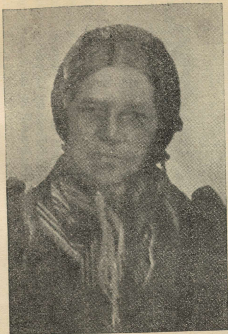
A. Laikmaa ema.