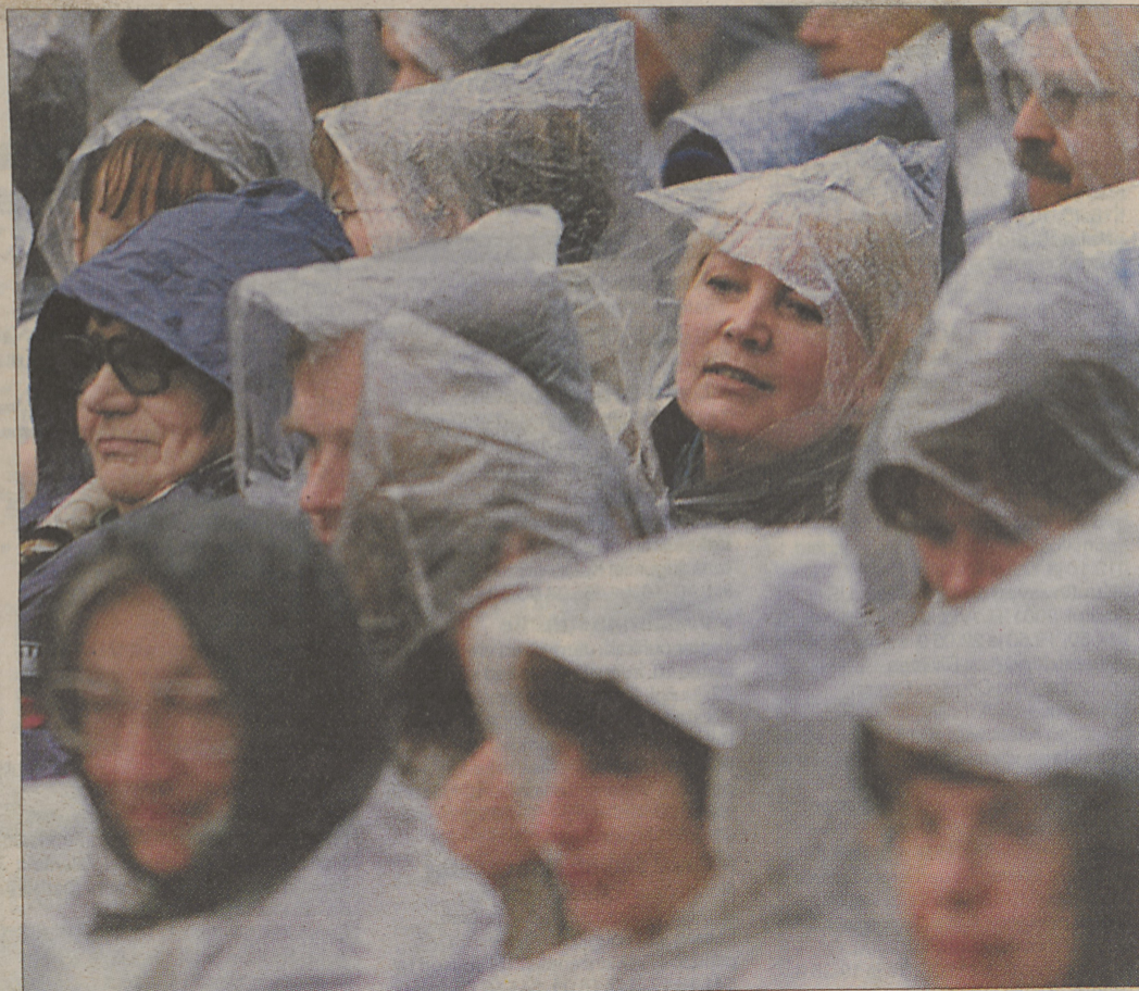
Juunikuine Eesti ilm kuulsusi ei soosi. Kiri Te Kanawa kontserti tuli vihmavarjude all kuulata.

Meteoroloogia ja hüdroloogia instituudi agrometeoroloogid rehkendasid juunikuu keskmiseks õhutemperatuuriks Eestis 14,1° C, mis on pool kraadi jahedam normist, s.o pikaajalisest keskmisest. Sadas meil keskmiselt 94 mm vihma. Mõnel pool rohkem kui vaja, mõnel pool paarjalt.