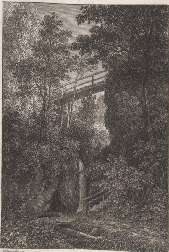
Die Teufelshöhle im Park zu Hinzenberg

In wenigen Gegenden wird wohl so viel auf die Verbesserung des Bodens verwendet, als in den sandigen