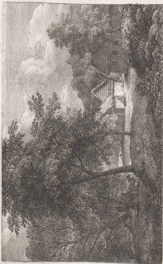
Die Hoffschule zu Bernsbury