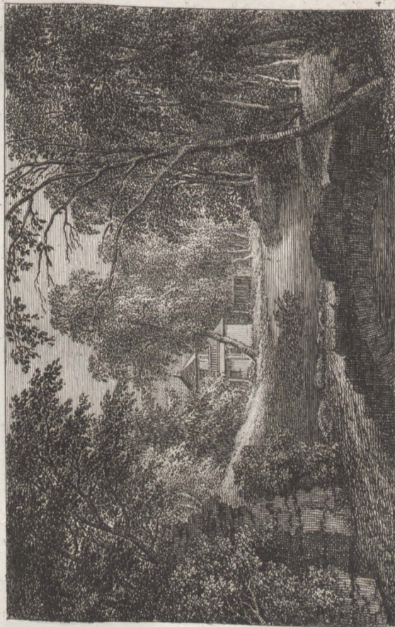
Ansicht aus Edls. Garten bey Riga