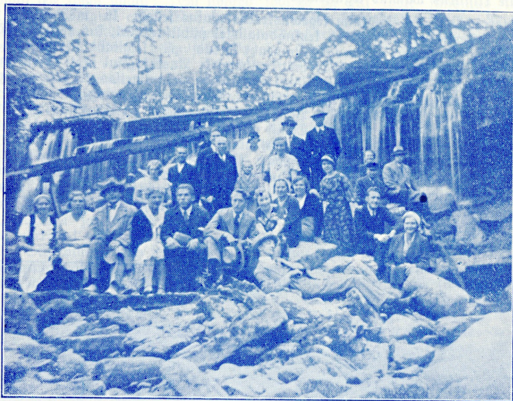
Teel Laulasmaale, peatus Keila-Joal.

Soolekandetoimfond jätkas eelmise aasta eeskujul waeste toetamist. Seks korraldati kaits perefondadhtut, iiks fewadel ja teine siigifel millistest ofawõdt kujunes eriti rohkearwulifeks. Perefondadhtul loteriil wäljalooftud käfitõid walmistati käfitõõõhtutel, millifeid peeti 21. Rogudufe waeseid külastati kolmel puhul üle linna. Soolekandetoimkonna juhatajaks oli prl. A. Rants .