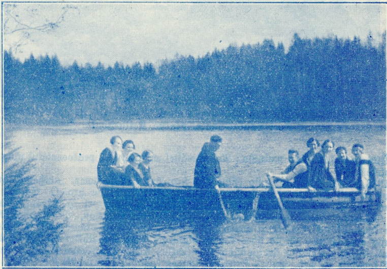
Raadisõit Aegwiidu järwel.