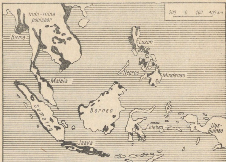
Riisikülvid Kagu-Aasias (mustaga märgitud alad).

Ka suurmajandeis on tähtsamaks kultuuriks riis. Riisipõllud jaotatakse osadeks väikeste, 25 cm kõrguste vallide abil, mis kergendavad vee reguleerimist ja on ühtlasi ka valduste piirideks. Peeaegu kogu riisi kasvu ajal katab