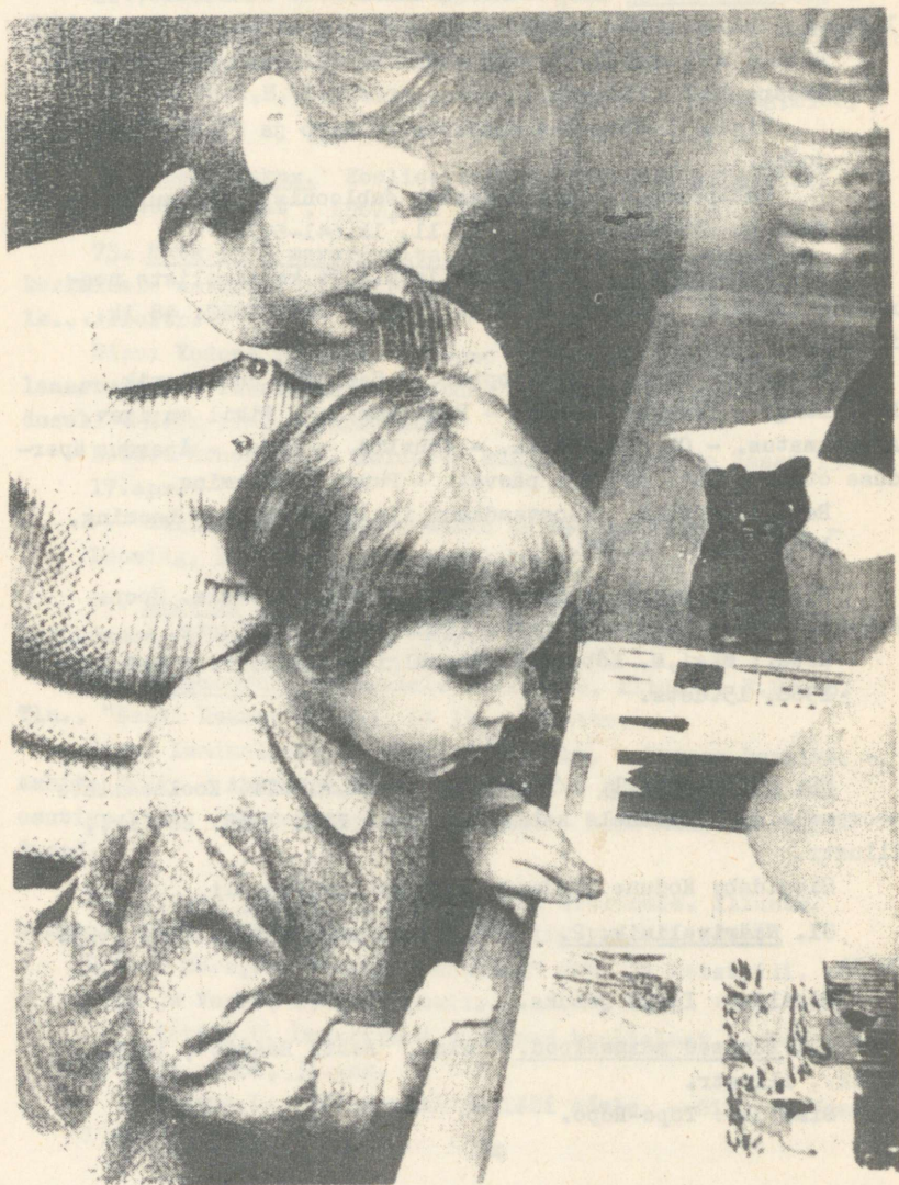
Poet oma noorima tütrega .