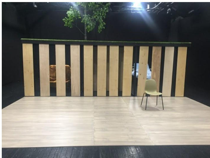
Foto 3. "Kõike head, vana toriseja" lavakujundus.

12. märtsil kuulutati riigis välja eriolukord, mistõttu pidime senised plaanid ümber tegema. Selle asemel, et teiste liitumisel ise kohapeal olla ja neid aidata, siis panin kokku faili, kuhu koondasin kogu vajaliku info lavastuse kohta (lisa nr 1). Lavastuse proovidega mindi siiski lõpuni ja lavastus tehti nii-öelda valmis, kuid mina enam proovides ei osalenud.