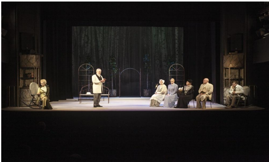
Foto 2. "Onu Vanja" lavakujundus.

Näiteks tekkis olukord, kus näitleja hilines lavale umbes minuti ja inspitsient oleks pidanud seda märkama ja probleemile lahendust otsima (näitleja üles otsima, vaatama miks ta ei ole lavale läinud). Kuna ma ei tundnud lavastust, siis ei saanud ma aru, et on tekkinud probleem ja isegi kui oleks, siis poleks ma teadnud kes lavalt puudu on.