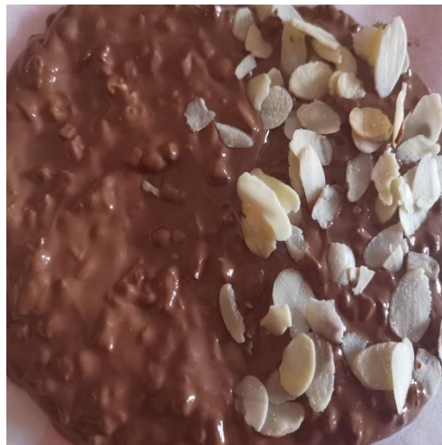
Foto 5–6. „Ahvatlevate šokolaadikeste“ valmistamine