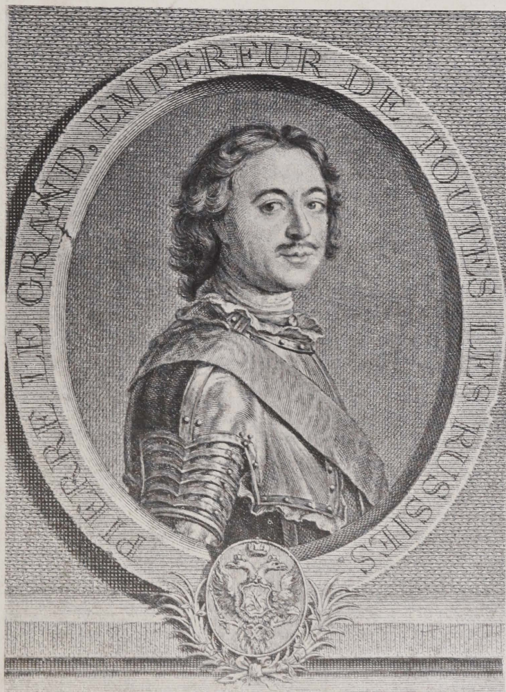
ПЕТРЪ ВЕЛИКІЙ (1717 г.) ПО ПОРТРЕТУ НАТЬЕ, ГРАВ. ЧЕМЕСОВА