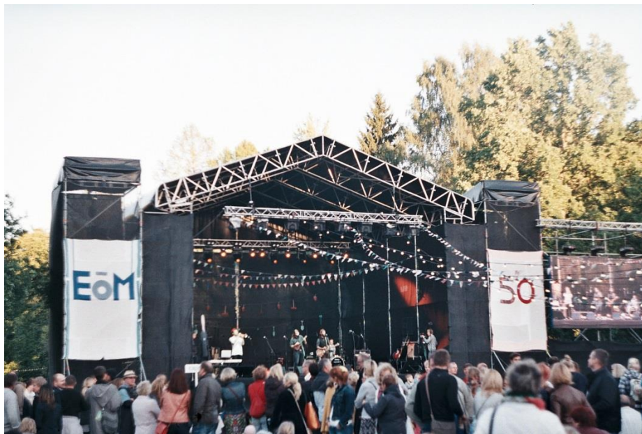
Foto 1. EÕM50 lavakujundus