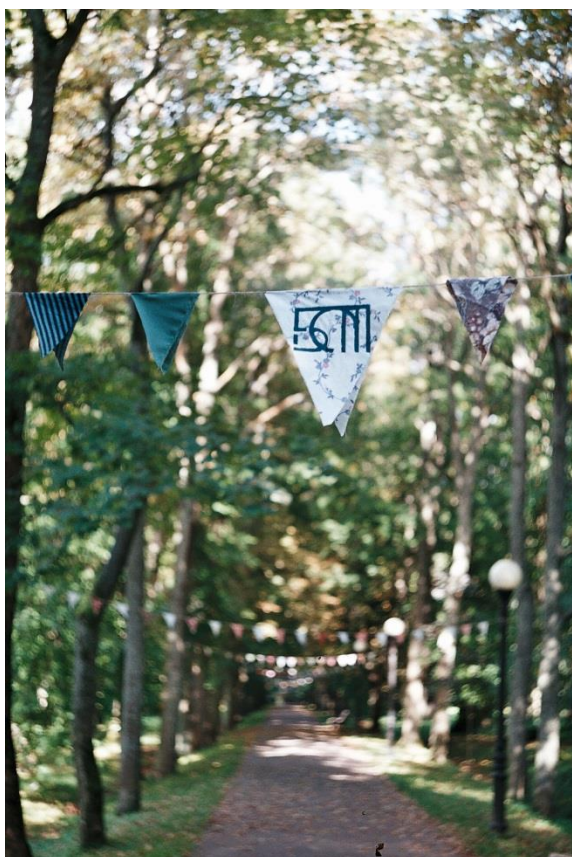
Foto 2. Lipuread Kadrioru pargis