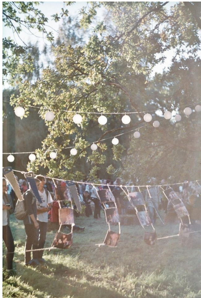
Foto 6. Galeriid ja valgusketid