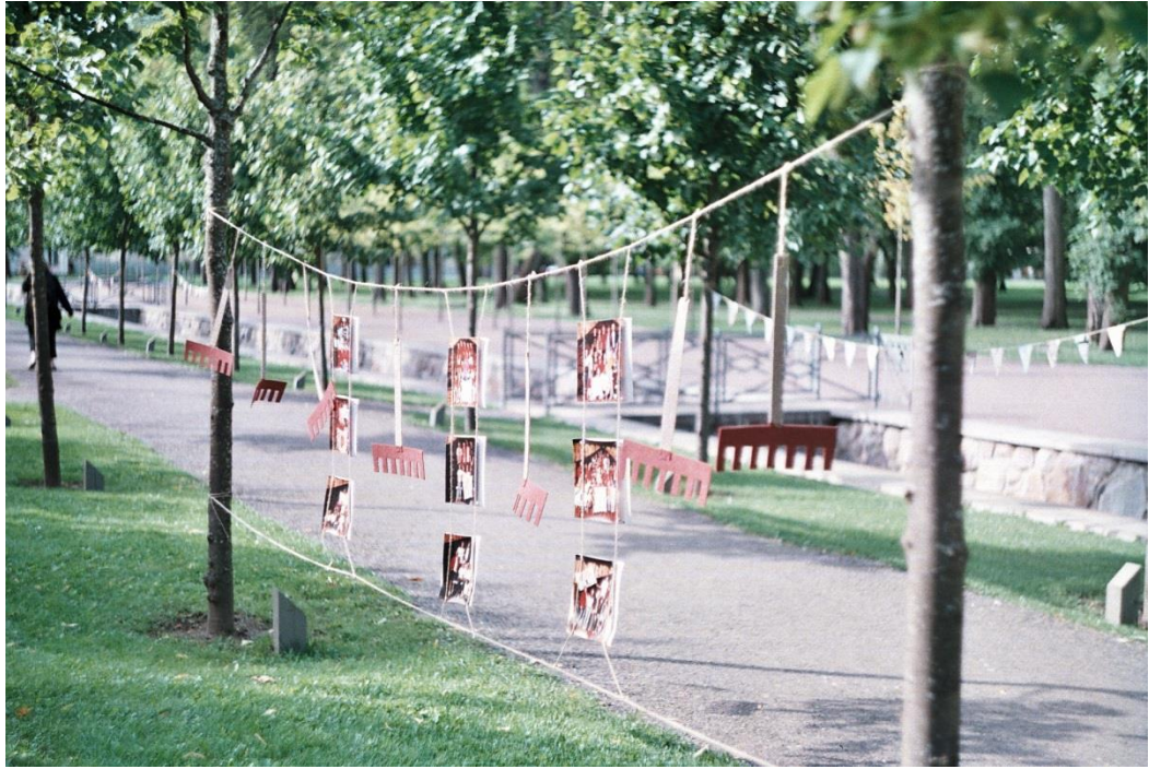
Foto 5. Galeriid ja vildist elemendid