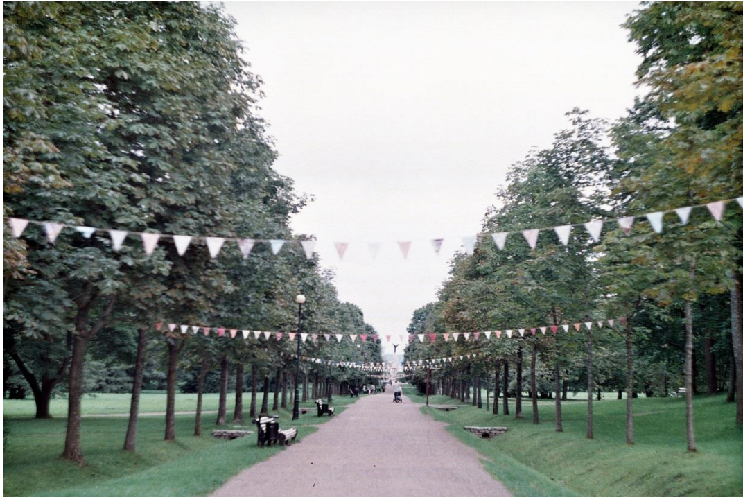
Foto 3. Lipuread Kadrioru pargis