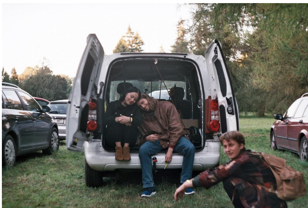
Foto 8. Kujundusvaldkonna tuumigrupp kontserdipäeval