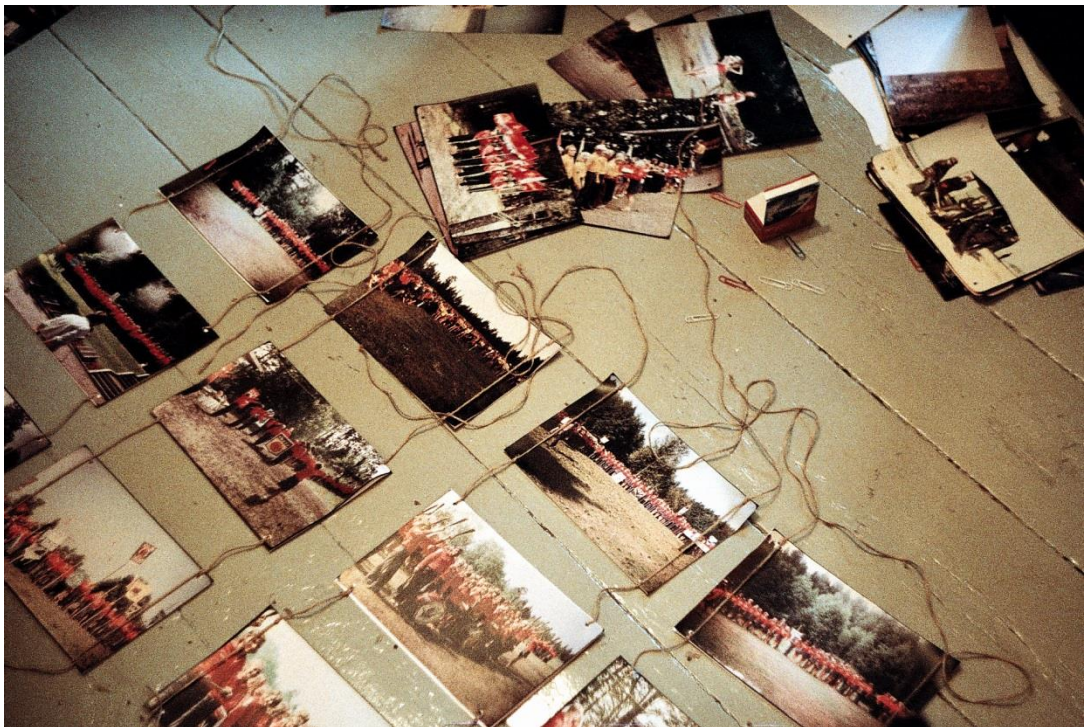
Foto 4. Vakstule trükitud fotod, galeriide ettevalmistamine