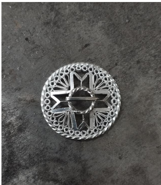
Joonis 7. Filigraantehnikast inspireeritud sõlg/ Autor: Mari Roose