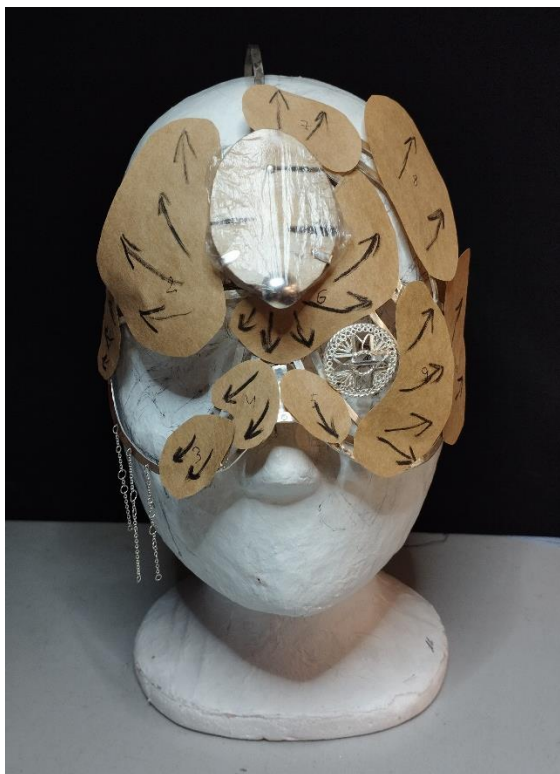
Joonis 8. Vaheplaatide šabloonide peale märgitud puukoorte liikumissuunad/ Autor: Mari Roose

alusraami külge ankurdamiseks kasutasin taaskord neete. Need olid 0.82 mm paksusest traadist, kinnitatud sama tehnikaga, mida tarvitasin alusraami osade needistamiseks.