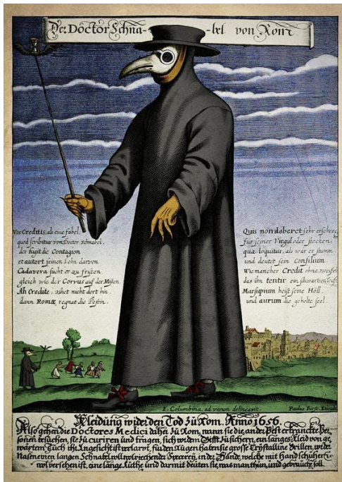
Joonis 3. Katkudoktori mask ( https://publicdomainreview.org/collection/plague-doctor-costumes/ )

inimestes vastupidiselt nende kaitse-eesmärgile hoopis hirmu tekitavad tasub ära mainida ka gaasimaski, tuntud ohu ja katastroofide sümboli.