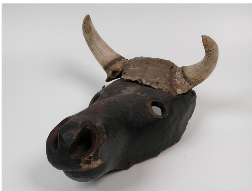
Joonis 2. Näärisoku mask ( https://www.muis.ee/museaalview/470102 )

Meie kultuuriloost teada olevad maskid on santide maskid. Sanditamas käidi teatud pühade ajal kindlate maskeeringutega, mis võisid kujutada omapäraseid mehi-naisi ja mitmekesiseid loomi (joonis 2). Maskeeritute eesmärk on käia teiste inimeste uste taga majaelanikke lõbustades ja tuues õnne edasisteks tegemisteks. Vastu said maskeeritud süüa ja juua. (Loomadeks maskeerumine s.a. ) Enese maskikandja eest varjamine, ukse mitte avamine või söögi-joogi mitte pakkumine tähendas majarahva jaoks õnnetust. (Hiiemäe, 2022, lk 100-101) Tänapäevaks on sellest traditsioonist alles jäänud vaid mardi- ja kadrisandid.