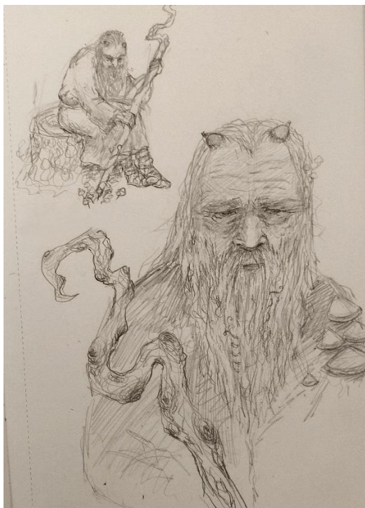
Joonis 1. Metsavana vanamehe vormi interpretatsioon/ autor: Mari Roose