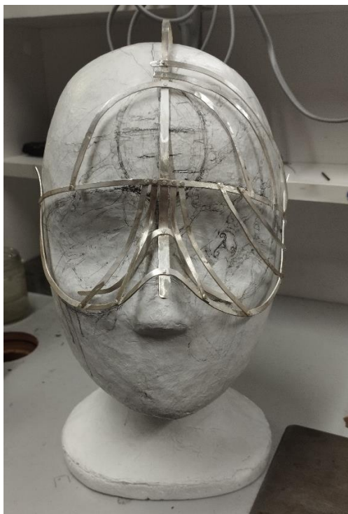
Joonis 6. Alusraam/ Autor: Mari Roose

Raami põhiline eesmärk oli pakkuda tugipinda, mis hõlbustaks puukoore tükikeste lisamist, tugevdaks konstruktsiooni ja jaotaks maski raskust. See ei tohtinud jääda valmis maskis domineerima. Kavandades leidsin, et jättes hõbedast konstruktsiooni puukoorte segadiku alt veidi nähtavale, võib see võimendada metsavana müstilist olemust.