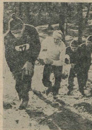
Pildil: Murdmaajooksu-võistlused Tartu linna mäe- ja murdmaausatajatele. Esiplaamil esikohale tulnud ülikooli mees- ja naiskond.