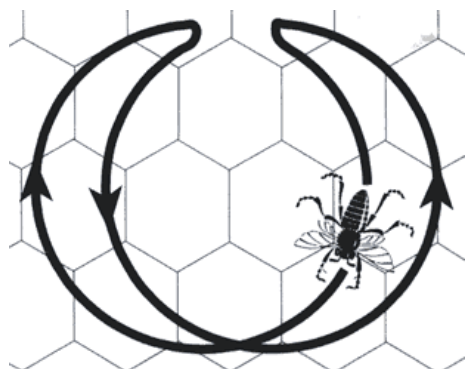
Illustratsioon 2. Mesilaste sirbitants. 42

Sirbitants ehk sickle dance on esmakordselt mainitud ja kirjeldatud Tschumi poolt ning see on õõtsutus- ja ringtantsude vahevorm. Selle esitamisel liigub mesilane sirbi kujulises joonises (Illustratsioon 2), kusjuures sirbi kuju avatud osa on suunatud korjekoha poole, kuhu tantsuga teisi mesilasi suunatakse (Frisch 1967: 280).