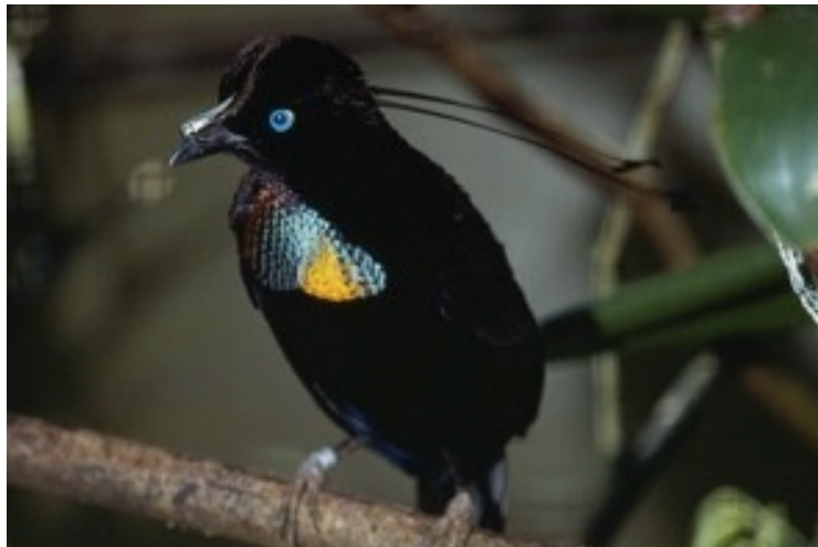
Illustratsioon 3. Hõbelaup-paradiisilind ( Parotia lawesii ). 45

Hõbelaup-paradiisilind kuulub paradiislindlaste sugukonda ja elab Paapua Uus-Guinea mägimetsades. Toitub peamiselt puuviljadest, seemnetest ja lüljalgsetest (Illustratsioon 3).