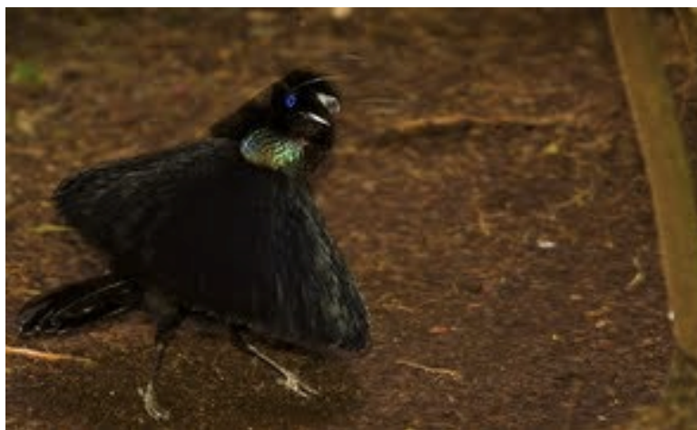
Illustratsioon 4. Höbelaup-paradiisilind sooritamas tantsu esimest osa. 46

Höbelaup-paradiisilinnu tants on väga visuaalne ja mitmeosaline ning selle võiks jaotada kolmeks alat samas järjekorras esitatud osaks. Esimeses osas lind kummardub ette tõstes saba kõrgele, astub siis järkjärgult keha sirutades mõned sammud samal ajal oma sulgi sellisteks seades, et lind näeb kõrvaltvaates välja nagu kelluke. Oma peas olevad traadilaadsed moodustised, mis muidu selja poole ripuvad, lükkab ta tantsu esimese osa alguses kehast ette poole ning ajab need laiali, seejuures püstiselt (pärisinimese moodi) kahel sirutatud jalal edasi-tagasi ja küljelt-küljele tammudes (Illustratsioon 4). Samal ajal raputab ta pead, kord rahulikumalt, kord ägedamalt, liigutades seeläbi hoogsalt traadilaadsete moodustiste otsas olevaid sulgi kaares küljelt küljele.