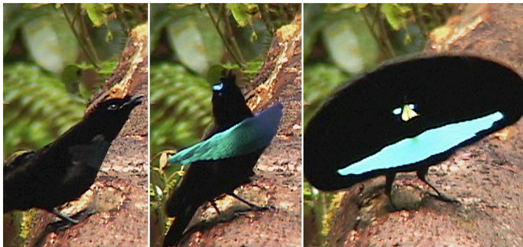
Illustratsioon 5. Hölmik-paradiisilind enne tantsu alustamist, vahepealse staadiumis, tantsu sooritamise ajal. 49

Eestvaates (sama perspektiiv, mis emaslinnul) on ta kuju tantsimise ajal must ja lamedapinnaline ovaal, mille alumises osas on sinine naeratavat suud meenutav kujund ning selle kohal kaks helendavat laiku. Need ei ole linnu silmad, vaid vastavate sulgede peegeldus valguse käes.