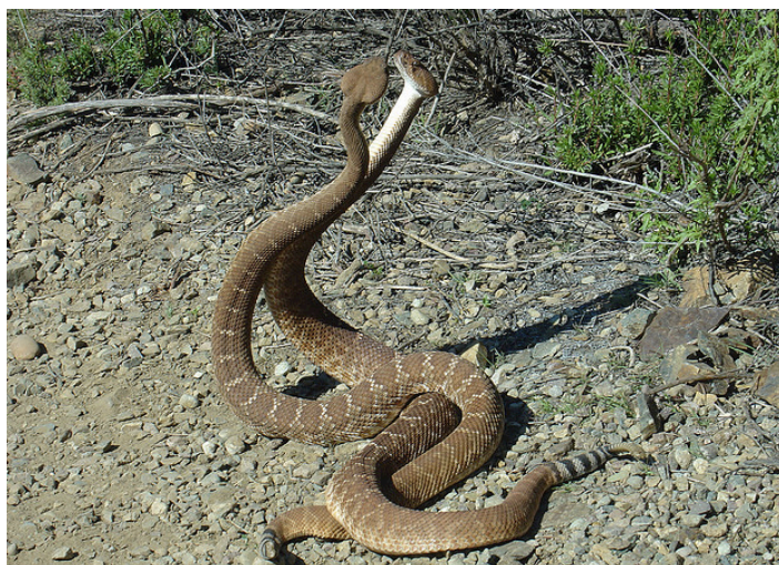
Illustratsioon 6. Lõgismaod võitlustantsu ajal end ümber üksteise mässimas, pead kõrgele tõstetud 52

Esimene paaritumise rituaal lõgismadudel on “võitlustants”, milles isaste kehad haarduvad seeläbi kinnitades oma domineerimist ja määravad nii kindlaks kumb saab peamise paaritumise õiguse. Nendes tantsudes isased viskavad oma keha ülemise osad kokku ja mässivad end ümber üksteise. 51