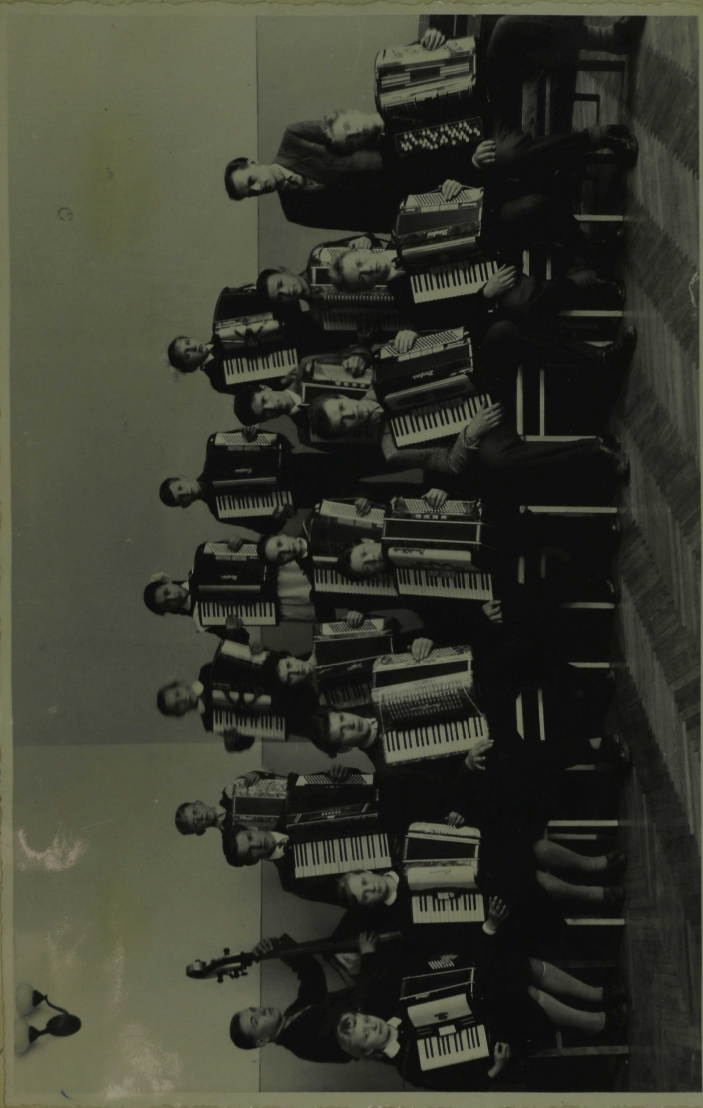
Kooli akordionistide ansambel