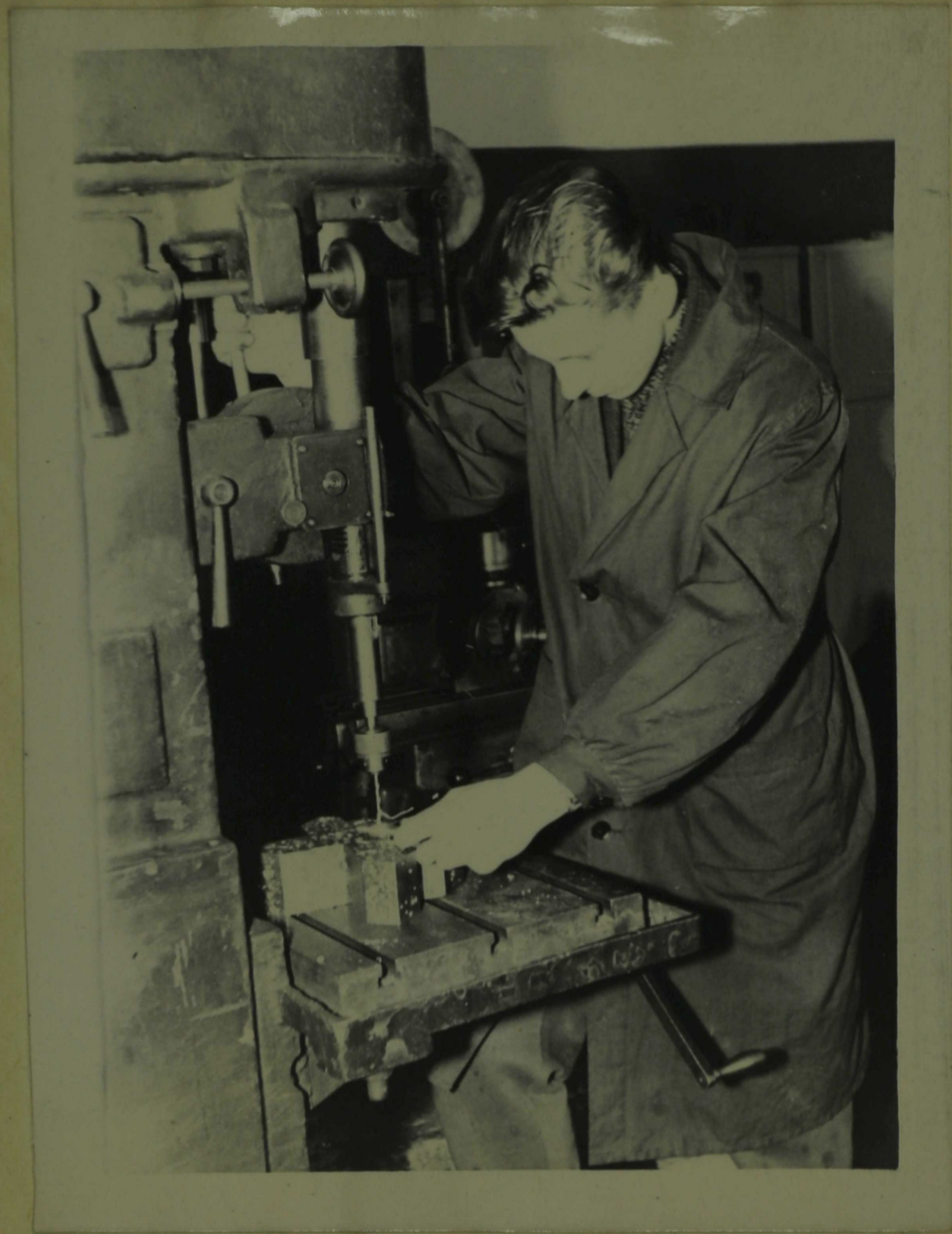
Õpilane töötamas puurpingil