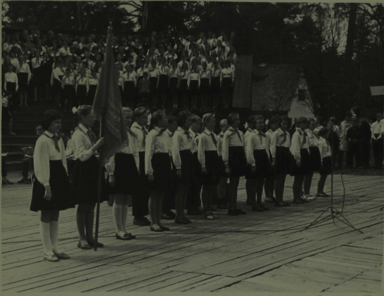
Pioneerid rajooni laulupäeval