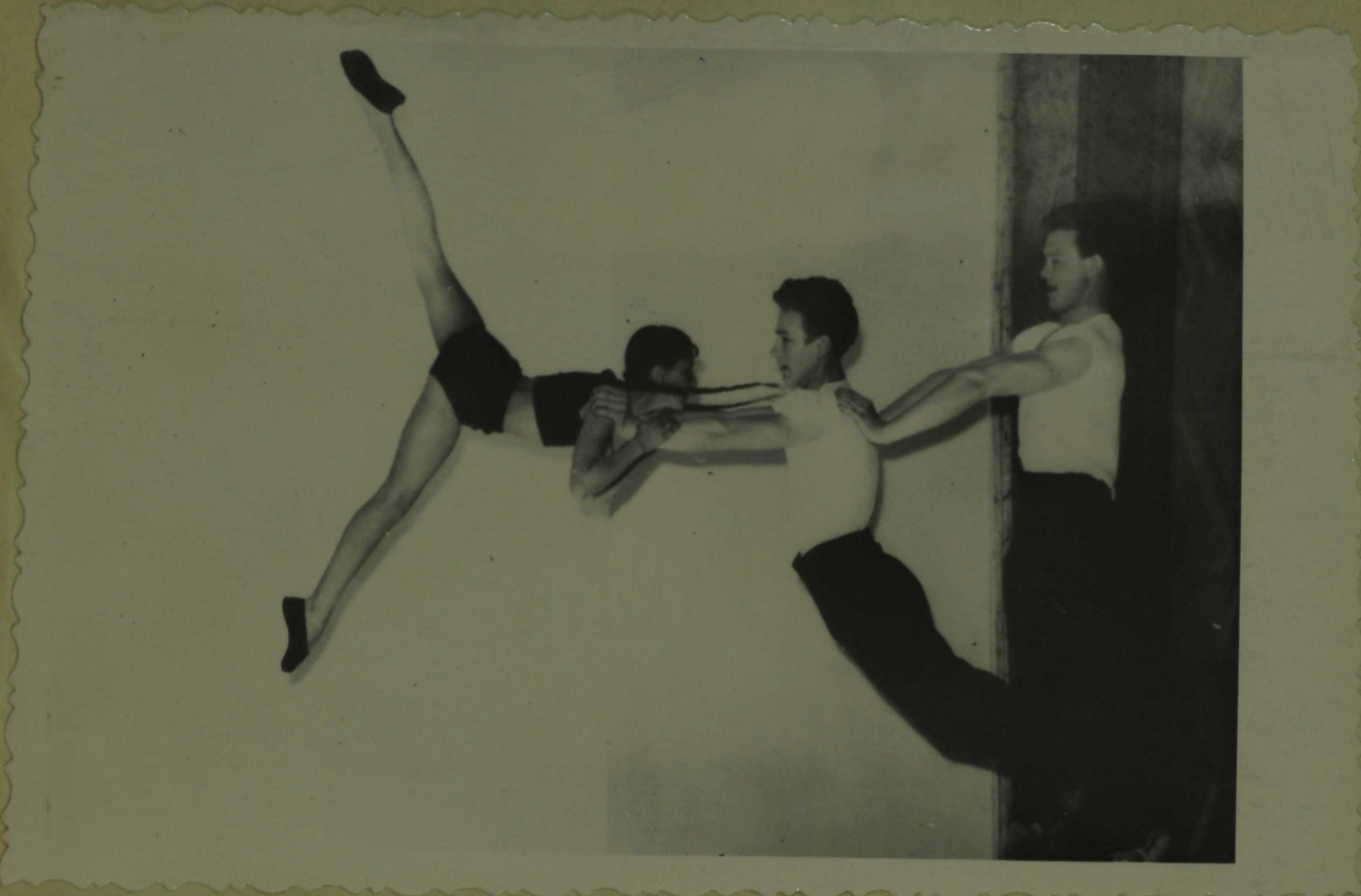
Õpilased sportliku võimlemise tunnis