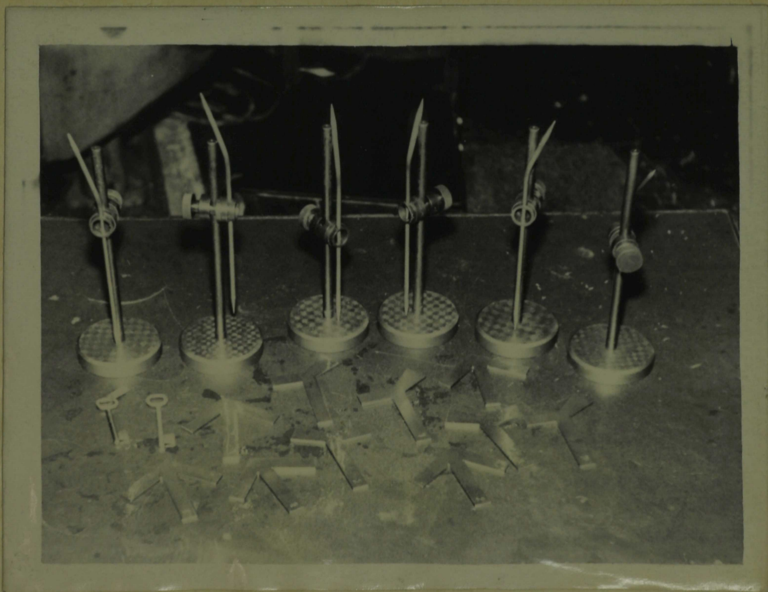
IX b klassi valmistatud tööd