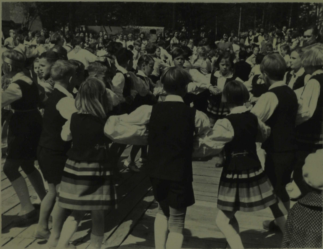
Mudilaste tantsurühm rajooni laulupäeval