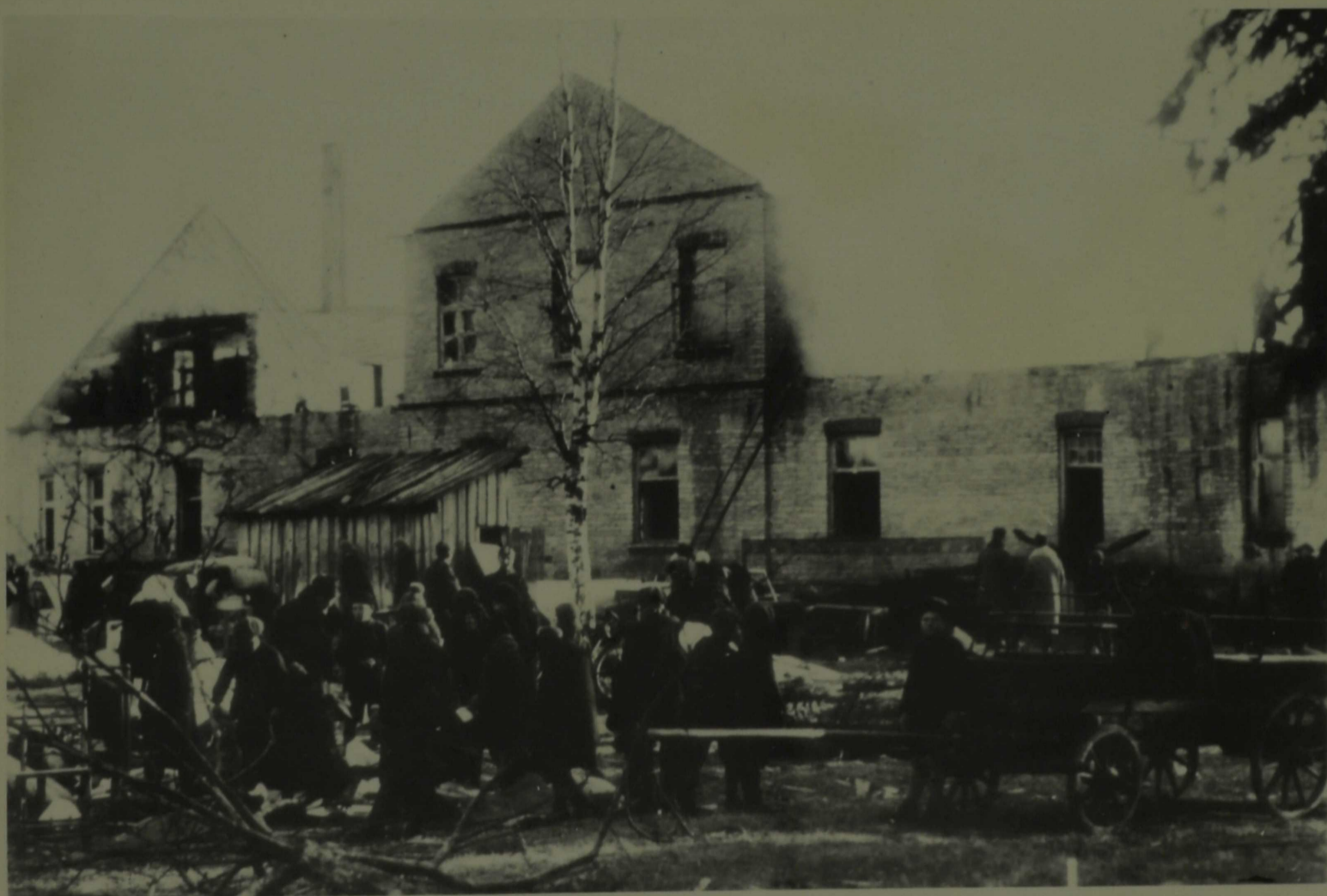
1927.a. kevadel pärast tuleõnnetust