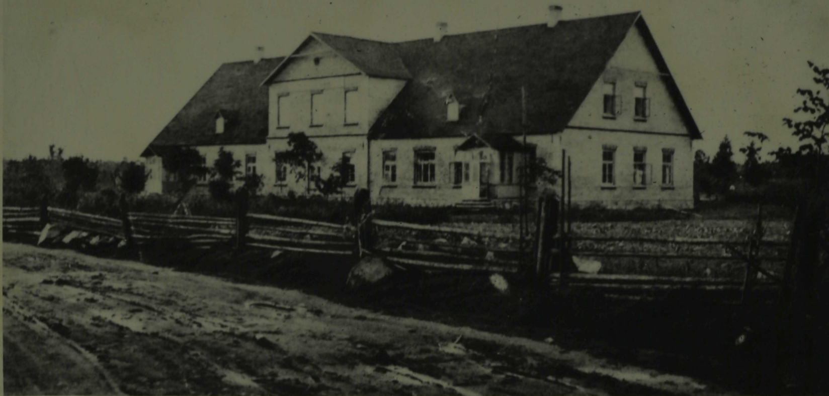
Koolimaja 1903.a. ja....