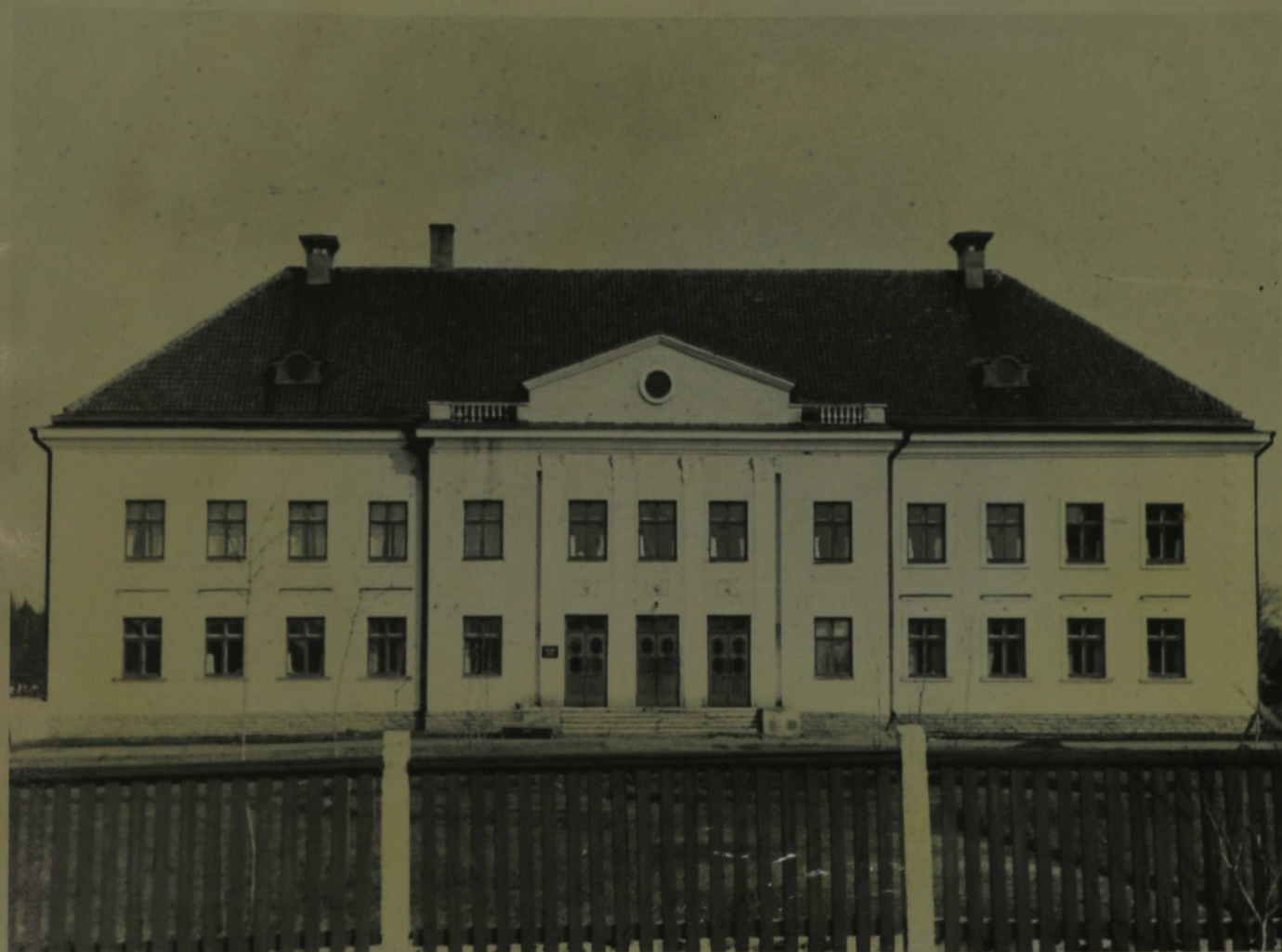
Kooli internaadi hoone