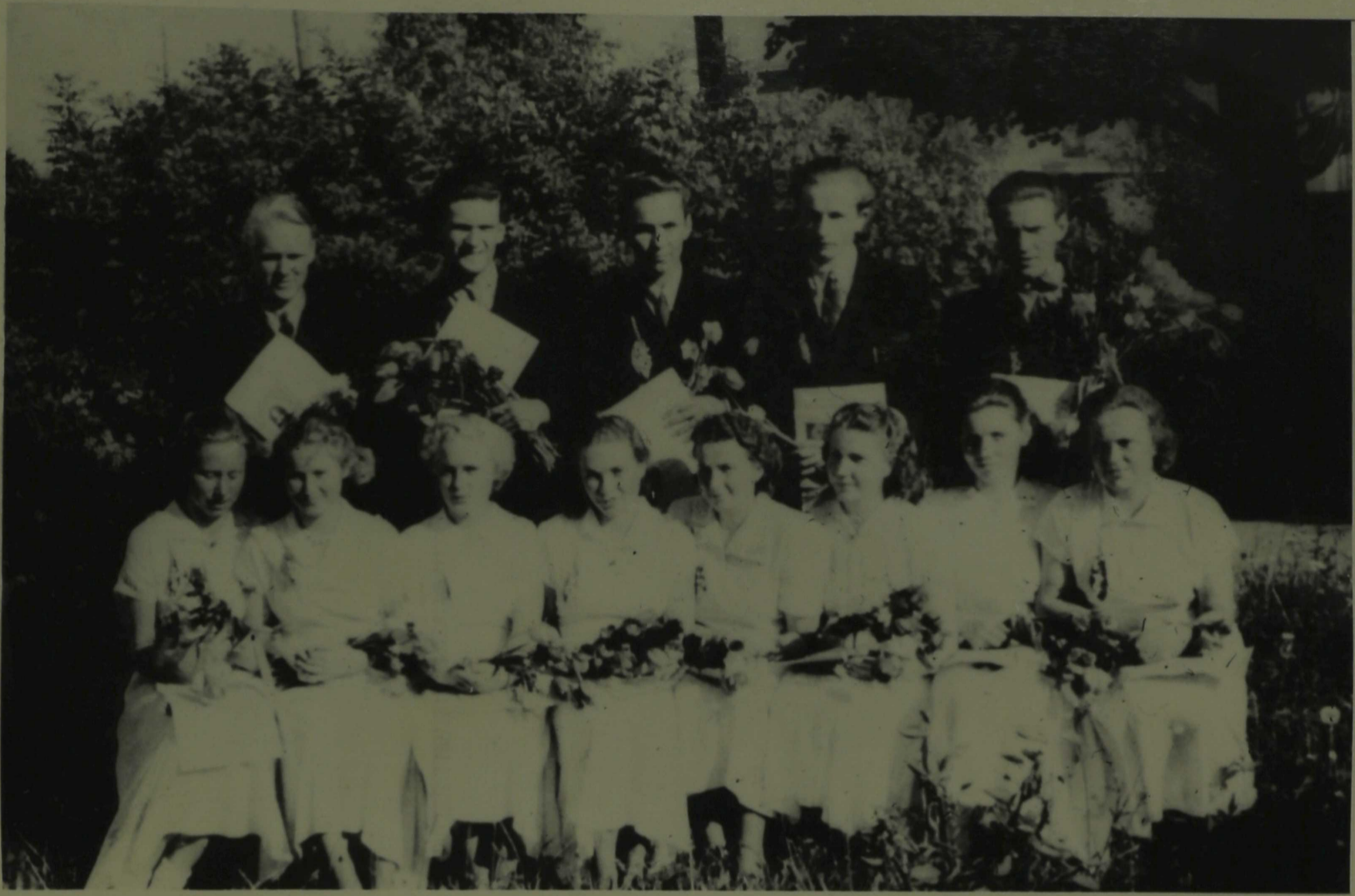
Loksa Keskkooli I lend 1955.a.