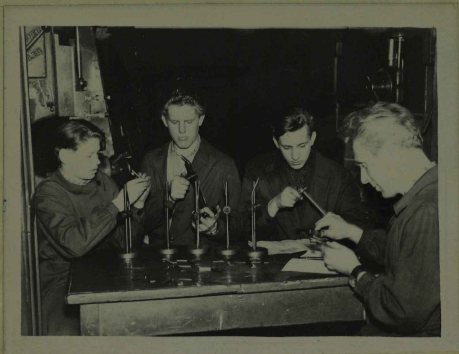
Valmistatud tööde kontroll