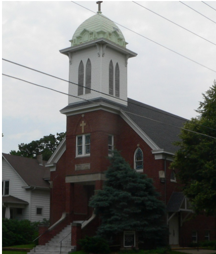
Abb. 7. Ebenezer Congregational Church.

Bei dieser Kirche handelt es sich um die Ebenezer Congregational Church im historischen Viertel South Bottoms von Lincoln in der 801 B Street. Es wurde erstmals 1915 von den SB-Wolgadeutschen eröffnet. Bis zur Einführung der englischen Sprache in den 1930er Jahren wurden alle Gottesdienste auf Deutsch abgehalten. In den 1950er Jahren wurde der Einsatz von Deutschen vollständig abgeschafft. Diese Kirche ist im National Register of Historic Places (NRHO) aufgeführt.