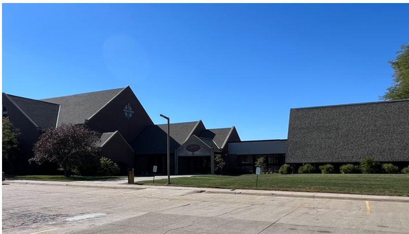
Abb. 6. Zion German Congregational Church.

Das historische Viertel South Bottoms weist einen architektonischen Charakter auf, der deutliche und bedeutende Verbindungen zur vorherrschenden wolgadeutschen Kultur in der Nachbarschaft aufweist. Der Bezirk besteht aus Haustypen, die sowohl in ihren russisch-deutschen Assoziationen deutlich zum Ausdruck kommen als auch solchen, die kulturell von amerikanischen Typen beeinflusst sind, und spiegelt einen Großteil der Gestaltung des Dorfes der Alten Welt im Umfeld der Neuen Welt wider (Murphy & Fimple, 1980, S. 11)