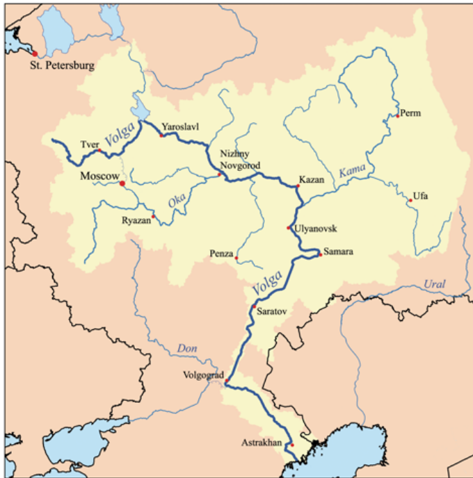
Abb. 1. Wolgadeutsche Kolonien in der sowjetunion.

Die Wolgadeutschen verließen ihre Gemeinden nicht wirklich. „Deutschsprachige Menschen betrachteten ihre Dörfer als das Zentrum ihrer Welt und nur wenige wagten sich über ihre Heimat hinaus“ (Kinbacher, 2007, S.32). Im Ergebnis führte dies zu einer Trennung zwischen Russen und Wolgadeutschen. Die Wolgadeutschen hatten weiterhin eine separate Gesellschaft und Sprache, die sich nie in die russische Gesellschaft einfügten. Die Abgeschlossenheit der Wolga-Kolonien war so vollständig, dass Linguisten sie als Sprachinseln bezeichnen. Sie verschmolzen unterschiedliche, archaische deutsche Dialekte und eine Handvoll russischer Substantive zu unterschiedlichen Umgangssprachen. In Balzer, aus der Pfalz. Achtzehn Kilometer entfernt produzierten die Bewohner von Norka einen Dialekt, der von hessischen Strukturen dominiert wurde. Wolgadeutsche erkannten Herkunftsdörfer durch Wortgebrauch und Akzente (Kinbacher, 2007, S.33). Dies ist ein weiterer Beweis dafür, dass die Wolgadeutschen wirklich in ethnischen Enklaven lebten, anstatt sich in die russische Gesellschaft zu integrieren. Obwohl das Leben eine Zeit lang friedlich blieb, begann es in den 1860er Jahren für die Wolgadeutschen in Russland schwieriger zu werden. In den Jahren 1886–1990 stieg die Emigration außerhalb Russlands um 546 Prozent (Williams, 1909, S. 80). Die Wolgadeutschen begannen ihre Rechte zu verlieren, die