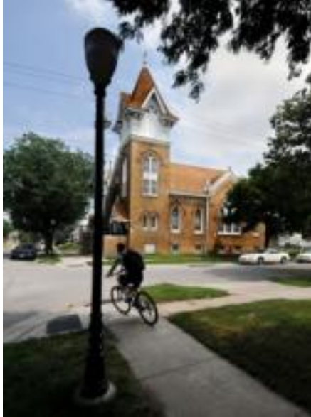
Abb. 5: German Evangelical Congregational Salem Church in Lincoln.

Da die Religion für die Wolgadeutschen Kolonien sehr wichtig war, gehörten ihre Kirchen zu den einflussreichsten Bauwerken. Dies ist ein Bild der German Evangelical Congregational Salem Church in Lincoln. Am 18. August 1901 einigte sich eine Gruppe darauf, diese Kirche zu errichten. Es wurde an der 9th Street und der Charleston Street gebaut. Dies ist jedoch nicht das ursprüngliche Gebäude, da die Salem Congregational 1916 ihr ursprüngliches Gebäude durch die heutige Kirche ersetzte (siehe Bild oben). Daher handelt es sich bei diesem Gebäude leider nicht um den ursprünglichen Bau der Wolgadeutschen. Die Kirche wird jetzt auch als Erlöser Presbyterian Church bezeichnet, sie ist nicht mehr als evangelische Kongregation Salem bekannt.