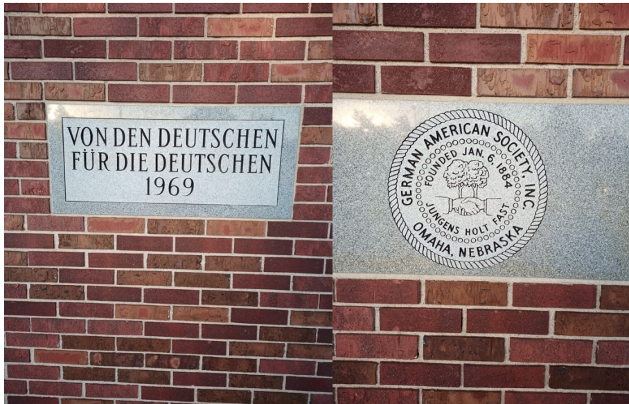
Abb. 8. German American Society Building.

teilnehmen können, z. B. Die Singenden Wanderer (Männergesangsgruppe), Heimat Tänzer, Brettspiel Klub, Wurst Klub, Deutsch Unterricht usw.