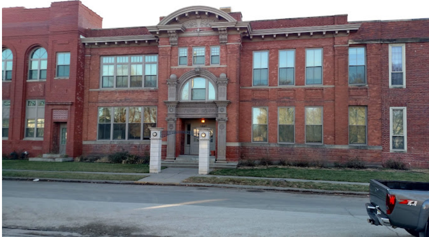
Abb. 4. Hayard place.

Dieses Gebäude hieß früher Hayward Elementary School. Ihr zentraler Teil stammt aus dem Jahr 1904, mit Anbauten im Süden im Jahr 1913 und im Norden im Jahr 1925. Die Schule heißt heute Hayward Place und wurde in den 1980er Jahren in Wohnungen umgebaut. Aufgrund seiner architektonischen und sozialgeschichtlichen Bedeutung ist es im Nationalen Register historischer Orte aufgeführt und erinnert an spezielle Programme zur Befriedigung der Bedürfnisse von Einwandererkindern (Zimmer, 2014, S. 1).