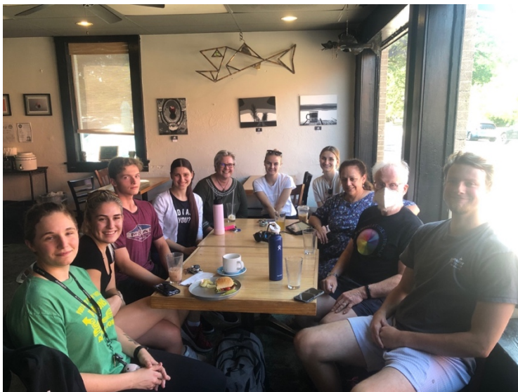
Abb .9. Kaffeestunde, Lincoln. Kaffeestunde bei Mojava Café [1 Juli 2023]

Sprache in Nebraska am Leben zu erhalten. Unten sehen Sie ein Foto von der Veranstaltung, auf dem viele verschiedene Menschen zu sehen sind. Die Mehrheit der Menschen, die kommen, sind Deutschstudenten. Allerdings ist diese Veranstaltung nicht nur auf Studierende beschränkt, es gibt auch Menschen aus vielen verschiedenen Berufsfeldern, die an dieser Veranstaltung teilnehmen, entweder um Deutsch zu lernen oder um die Möglichkeit zu haben, ihre bereits vorhandenen Deutschkenntnisse aufrechtzuerhalten. Das Bild unten ist ein Bild von der Veranstaltung. Einige der abgebildeten Personen gehörten auch zu den Teilnehmern des Online-Fragebogens.