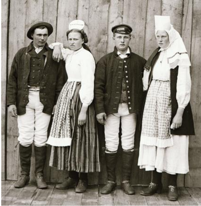
Foto 1. Käina rahvas 19. sajandi lõpus.

ehted, põll, peakate (tanu, palmik jne), suurrätt, kindad ja kuub või vest. Umbes 1840. aastatest hakkasid hiiu naised kandma musta ühevärvilise seeliku asemel triibuseelikuid. Lääne-Eesti kihelkondadele omaselt oli 19. sajandi teisel poolel Hiiumaal levinud tumedatooniline leina- ja paasturiietus. Meeste riidekomplekt koosnes saabastest või kingadest, tumedatest sukkadest, kintspükstest, linasest särgist, kampsunist ehk jäkust, kuuest ja mütsist või kaabust. Rõivamoe üheks mõjuriks oli merekaubandus ja seekaudu varieeruv kaubavalik – sh lõnga värvitoonid. 76 (Foto 1; joonis 1)