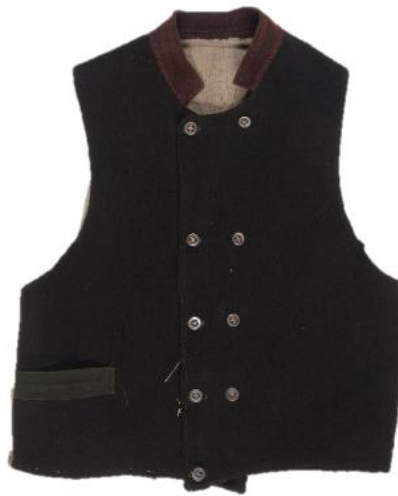
Joonis 12. Käina meeste vest, mis on valmistatud kalevist ning kaunistatud metallnööpidega.

Veste hakati Hiiu maal kandma alles 19. sajandi esimesel poolel. 275 Veste mainitakse protokollides erinevatel puhkudel – kord on tegemist sulase palgaga, 276 kord on see kabluse käigus lõhki rebitud, 277 kord on need päranduseks jäänud. 278 Toimikust selgub, et veste õmmeldi ise, sest ühel juhul palus naine teiselt, et