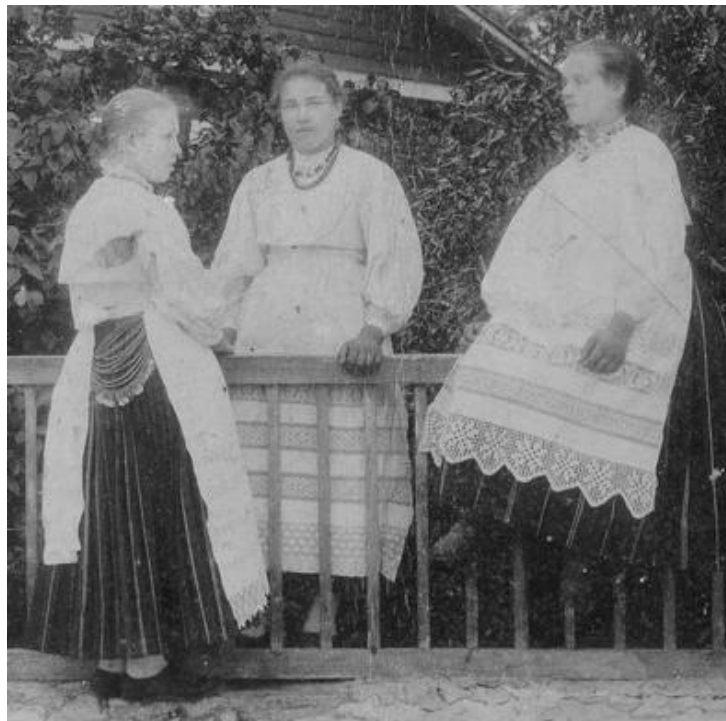
Foto 6. Lõuna-Hiiumaa neiud helmekeedega 1896. aastal. (“Hiiu rahvariides neiud Haapsalus 1896.a. HKM Fp 933 F 4999,” MUIS, https://opendata.muis.ee/object/2181089 (13.05.2025))

Ainukesed nii meeste kui naiste rõivastuse hulka kuuluvad esemed, mida pole protokollides esindatud, on rinnaehted. Särgi või käiste kinnitamise vahendiks olid laialdaselt levinud paarisentimeetri suurused vasest või hõbedast vitssõled, mida kasutasid nii mehed kui ka naised. 490 Selle külge võisid naised riputada klaasist ripatsi. Samuti kuulus naiste rinnaehete hulka nelja või kuue värvilise silmaga ehk klaastahukaga aga ka silmadeta preese. 491 Nende hinnalise väärtuse tõttu võiks eeldada, et tegemist võis olla populaarse varastamisobjektiga, kuid kohtuprotokollidele tuginedes võib väita, et vastupidiselt peeti