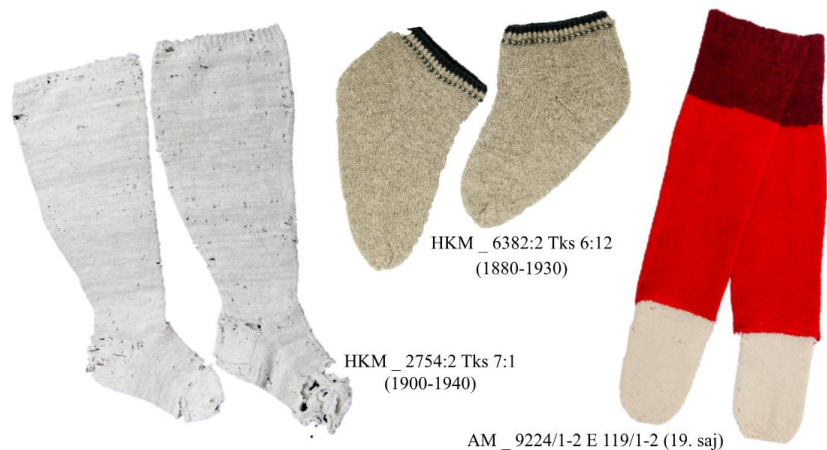
Joonis 20. Villased sokid-sukad 19. sajandi lõpust ja 20. sajandi alguse Käinast.

Käina naiste pidupäeva sukad võisid olla kirilõngast, aga ka ühevärvilised – punased, valged ning leina ajal sinised. 341 (Foto 4, 6; joonis 1, 14, 19, 20.)