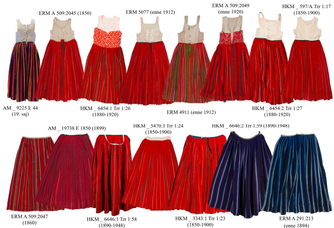
Joonis 15. Käina triibuseelikud 19. sajandist ja 20. sajandi algusest: punased pidulikumid seelikud ja sinised leinaseelikud. Punased seelikud koos kehaosa ehk pihikuga.

Käina umbkäised olid varasemal ajal kurrutatud, sajandi lõpupoole pitsiga kaunistatud pikkade varrukatega pihakatted, mida kanti öödri ehk pihaosa peal. 317 Neid mainitakse ainult seoses varastamisega, 318 millest ühel juhul on lisatud, et need olid olnud õues pleekimas. 319 Üks protokoll täpsustab, et tegemist oli käiste riide ja kraega, mitte valmis käistega. 320 See riie võis olla linane, millest valmistati igapäevaseid käiseid ja mis oli kasutusel enne uhkemate kangaste, nt kalinguri kasutusele tulekut 19. sajandi II poolel. 321 Kasutatud on sõnavara käised , 322 käiksed . 323 (Foto 2, 4, 6; joonis 1, 14, 16, 19, 28.)