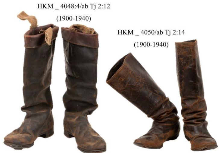
Joonis 2. 19. sajandi lõpu Käina meeste nahast saapad mitmest nahakihist kotsaga.

Teised kohtumaterjalides esinevad jalatsid on kingad. Tuginedes teadmistele 19. sajandi rõivaste kohta, olid hiidlastel need õmmeldud nahast tallaga ja nahakihtidest või puidust kotsaga ehk “hiuranti”. 171 (Foto 1, 6; joonis 1, 15, 19.) Valmistamisviisi protokollides aga ei mainita. Kingi on käsitletud seitsmes sissekandes, 172 millest kolmel korral on olnud tegemist meeste 173 ja neljal