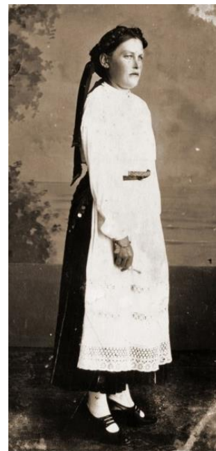
Foto 4. Emmaste-Käina tütarlaps rahvarõivastes (va kingad) 20. sajandi alguses.

Palmikuid on mainitud kolmes sissekandes, 326 millest ühes on need varastatud, 327 ühes katki lõigatud 328 ning ühes osana naise rõivaste loetelust. 329 Viimase alusel oli sellel naisterahval korraga kolm palmikut. 330 Ainuke protokollidest leitav kirjeldus informeerib, et need olid punased. 331 Seda kinnitavad ka säilinud esemed ning