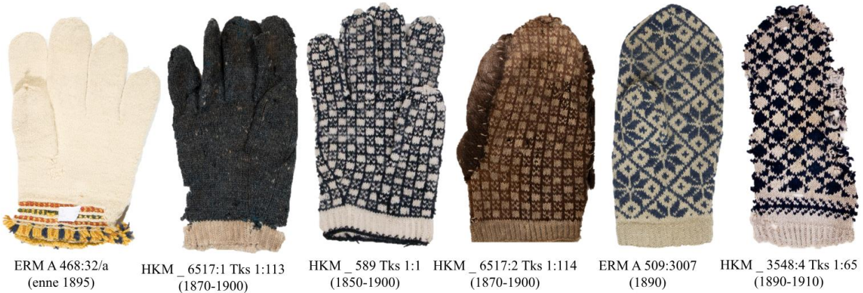
Joonis 22. 19. sajandi Käina villased kindad, sh naiste valge pulmakinnas.

rätikule lisaks rebenes ka särk. 379 Varastatud rätiku kahjutasuks on määratud 20 kopikat. 380 Rätik oli osa sulase palgast. 381 Käina protokollid 382 kinnitavad eelnevaid teadmisi, et rätikuid müüdi poes. 383