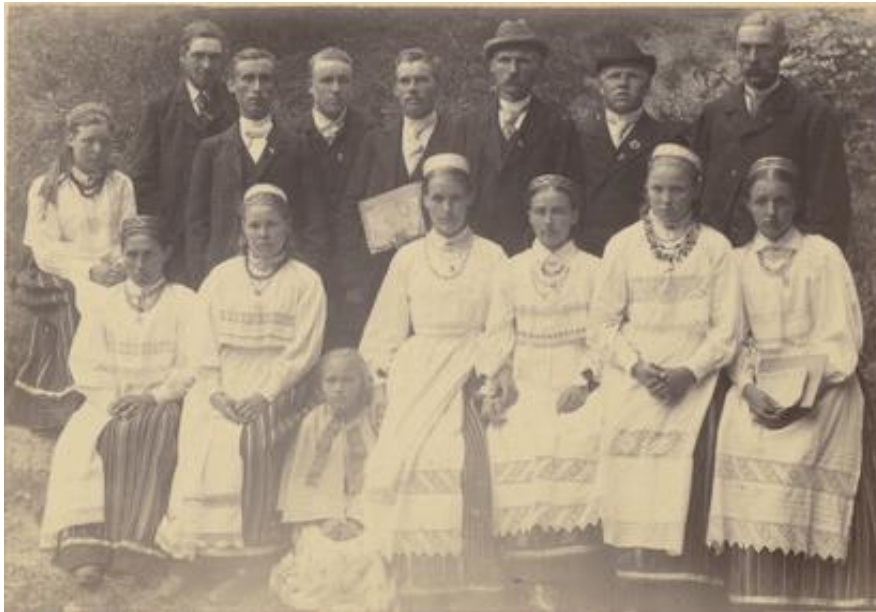
Foto 2. Käina segakoori neiud kandmas rahvarõivaid 1896. aasta üldlaulupeol. Meestel on seljas linnamoelised pintsak ja lips.

Hiiumaal toimus rahvarõivaste taandumine võrreldes ülejäänud Eestiga (va Kihnu, Setumaa ja veel mõne muu eraldatuma piirkonnaga, kus kantakse rahvariideid igapäevaelus tänase päevani 77 ) hiljem ning aeglasemalt ja traditsioonilisi talurahvarõivaid kanti kauem – seda eriti naiste seas, kes kandsid neid sajandi lõpuni. 78 Meeste rõivastus hakkas seevastu muutuma 19. sajandi kolmandal veerandil, kuna suurenes liikumine nii Hiiumaa-siseselt kui ka üle mere. 79 (Foto 2)