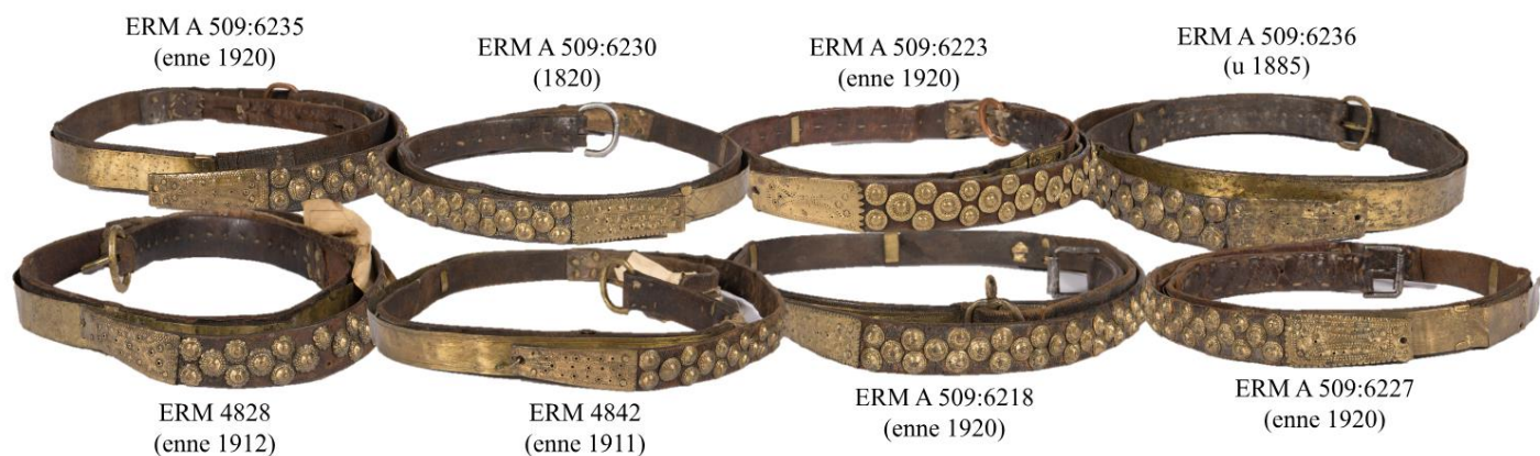
Joonis 25. Naiste vaskplaatidega nahast vööd 19. ja 20. sajandi Käinast.