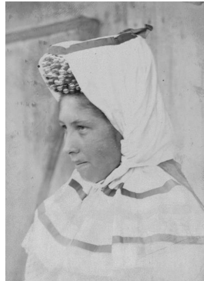
Foto 5. Käina pruut pearätikuga, mis katab pruudipärga ehk seplit.

Seitsmel korral on kirjutatud naiste rätikutest 355 – nt naese rätik , 356 rättikud . 357 On teada, et ümmardaja palgaks võis olla rätik 358 või raha selle soetamiseks, mis ühe juhtumi alusel oli 50 kopikat. 359 Ühel korral on kaks rätikut edukalt 360 ja teisel korral rätik mitte edukalt varastatud. 361 Viimasel juhul kirjeldab protokoll, kuidas nimetatud rätik oli mõni aasta tagasi Tallinnast