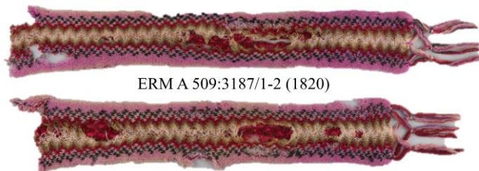
ERM A 509:3187/1-2 (1820)

Kaela ja käte katmiseks olid kasutusel nii sallid, rätikud kui ka kindad, mis kuulusid nii naiste kui ka meeste talvise rõivastuse juurde.