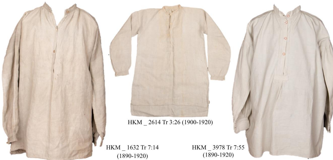
HKM _ 2614 Tr 3:26 (1900-1920)