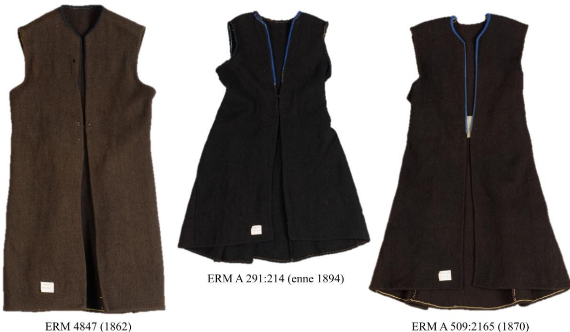
Joonis 3. Naiste villased kehakuued 19. sajandi II poole Käinast.

tribulisena küttkuueks. 191 Kuna kohtutoimikutest enamasti ei ilmne, kas on kirjeldatud seelikut või ülerõivast, siis ei ole võimalik naiste “kuubede” puhul täpseid järeldusi teha. Naistega seoses on kuubesid mainitud viies sissekandes 192 kasutades sõnavara kuub , 193 kub , 194 laikub . 195 Kuued 196 või kuueriie 197 on olnud osa tüdruku, teenija või ümmardaja palgast, kuna neljal korral on sellel teemal kohtus kuubesid mainitud. Ühel korral ilmneb see perenaise vara loetlemisel, mille alusel on tal kaks musta kuba , üks laikub ja lisaks veel wiis küüta . 198 Musta kuba all võib olla mõeldud nii musta värvi kuube ehk ülerõivast kui ka mustkuube ehk seelikut. Kahel korral on mainitud