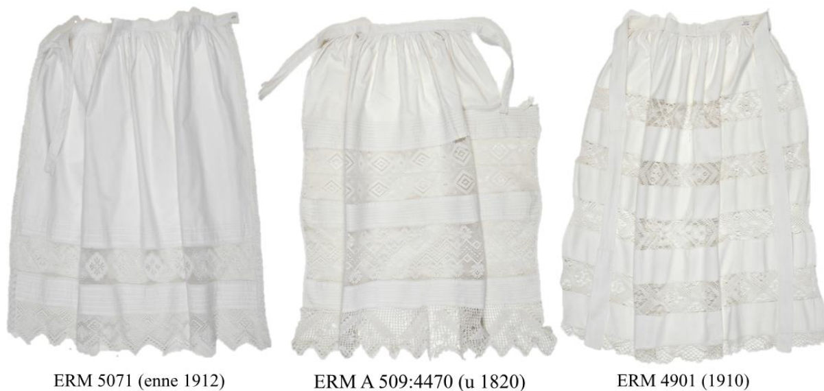
Joonis 17. Käina naiste pitsidega kaunistatud puuvillasest kangast põlled 19. ja 20. sajandi algusest.