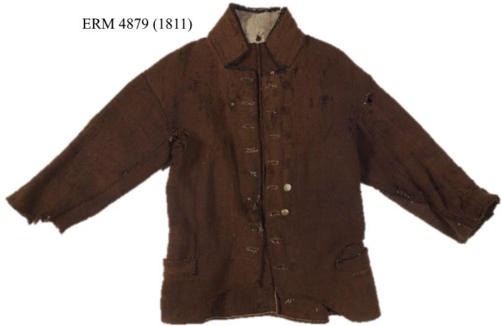
Joonis 8. Käina meeste linasest ja villasest riidest vatt 19. sajandi algusest.

Jäkud (jaku, vähejaku, vildne kuub) olid meeste ja naiste ülerõivad, mis oma materjalilt ja lõikelt sarnanesid pikk-kuubedega, kuid olid tunduvalt lühemad. 231 Samas võidi nimetada händadega pikk-kuubesid samuti jākudeks, nt meeste suurjākud, 232 mistõttu ei ole võimalik määrata, kumba rõivaeset on kohtuskäijad silmas pidanud. Neid on mainitud ainult ühes sissekandes, mille järgi oli pereisast alles jäänud kaks jākud ja tema naisel oli kolm jākud . 233