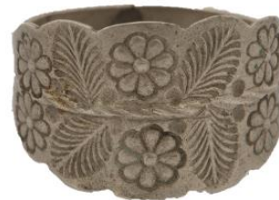
ERM A 509:6976 (u 1845)

Säilinud esemetele tuginedes kandsid Käinas nii naised kui mehed sõlgi ja muid ehteid. 396 Lähtuvalt ehte väärtusest ja nende kandjaskonna hulgast võiks eeldada, et neid võidi varastada ja sellest lähtuvalt neid kohtus käsitleda sagedasti, kuid vastupidiselt on nende kohtuprotokollides esinemine peaaegu olematu. Ainuke mainitud ehe on naise sõrmus, mis olevat tehtud hõbenoa peast. 397 Teaduskirjandusele tuginedes võib järeldada, et tegemist võis olla piduliku kihla- või laulatussõrmusega, kuna neid valmistati hõbedast. 398 (Joonis 26.)