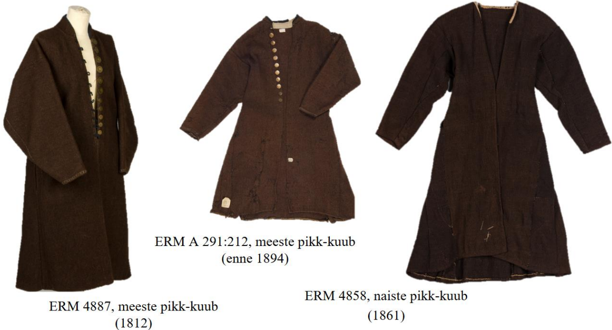
ERM 4887, meeste pikk-kuub (1812)

lisades sinna uut riidet. 209 Ühel juhul oli kuue valmistamiseks olemas 12 küünart riidet, 210 kuid pole teada, mitu kuube sellest pidi valmima. Nagu kolm sissekannet 211 kinnitavad oli tegemist villasest