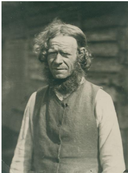
Foto 3. Käina mees vestiga 1894. aastal.

villastest musta värvi pükstest. 266 On teada, et sulane on nelja aasta jooksul saanud palgaks 11 püksipaari, millest vähemalt kahed on olnud villased ja ühed linased. 267 Vastupidiselt tumedatele talvepükstele kanti valgeid linaseid pükse suviti ja need ühtisid oma lõikelt villastega. 268 Ühel mehel võis korraga olla neli püksipaari, mis ilmneb lahkunud pereisa pärandusest lastele. 269 Protokollidest selgub, et pükse müüdi ka poes. 270 Samuti võidi poest soetada nööpe. 271 On teada, et Käinas kinnitati pükse vöökohalt kolme nööbiga. 272 Kasutatud on väljendeid püksid 273 ja paar püksid . 274