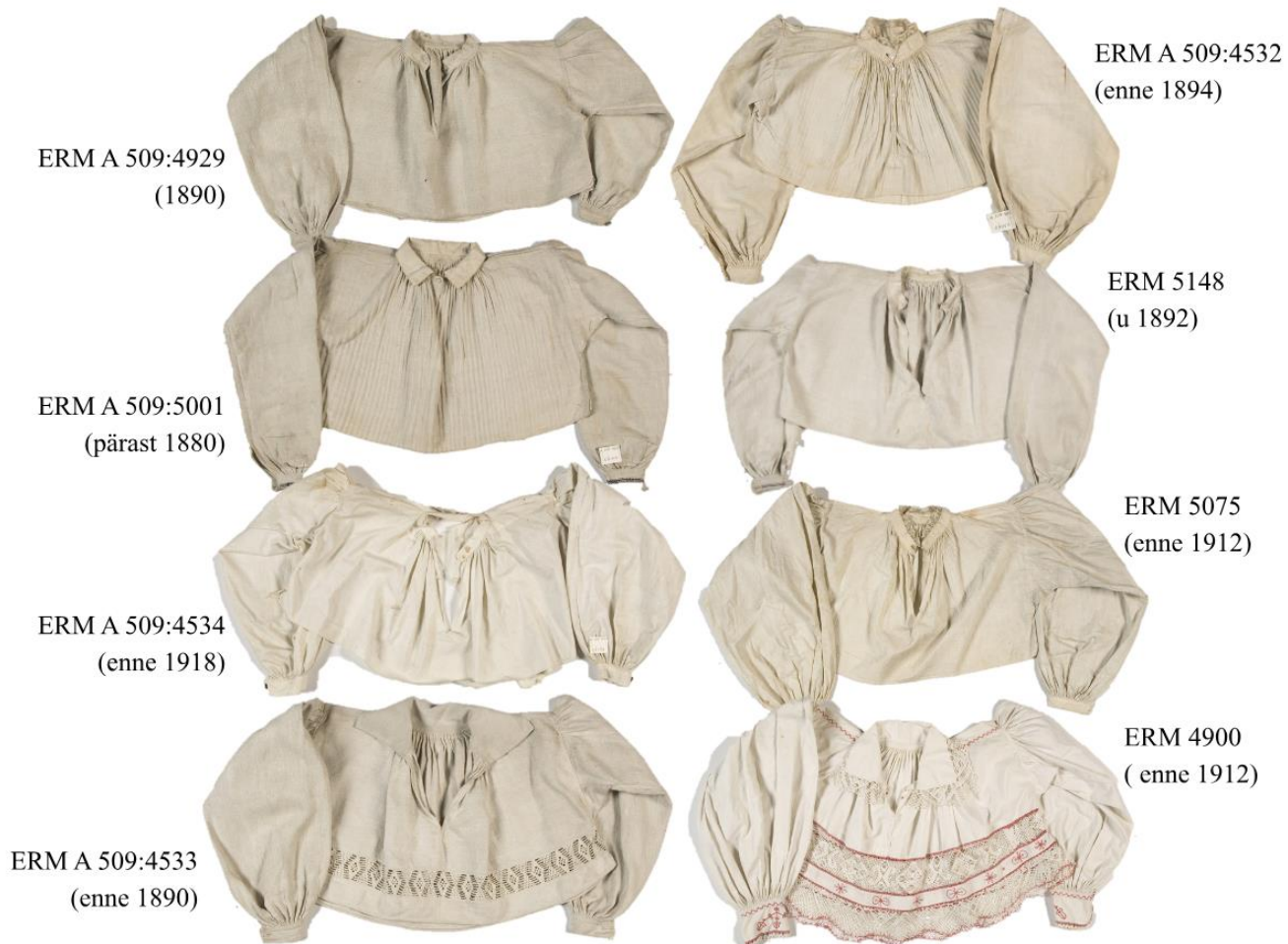
Joonis 16. Käina kaunistusteta, kurrutatud ja pitsiga kaunistatud linased ja puuvillased käised 19. sajandi lõpust ja 20. sajandi algusest.