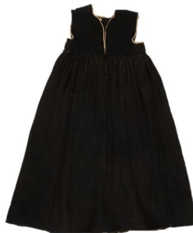
ERM A 291:193 (enne 1894)

Joonis 13. Emmaste kihelkonna villane mustkuub. Kuna Käinast pole mustkuubesid töö autorile teadolevalt säilinud, siis on toodud näide Käina naaberkihelkonnast Emmastest, kus kanti kõige sarnasemaid riideid.