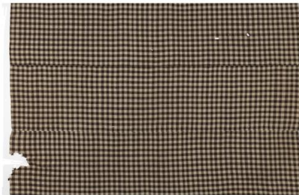
EVM E 101:104 (u 1870)

Mujal Eestis naiste suurrätina, kuid Hiiumaal vooditekina tuntud 427 sõba on kohtuprotokollides esindatud. (Joonis 27.) Seda on mainitud kahes sissekandes – mõlemas sõnaga sõbba , 428 millest ühel juhul on juurde lisatud sulgudes olev sõna tek , 429 teisel tekki (mitmuse osastav). 430 Protokollides mainitud sõbadest kuulub üks mehele, 431 ülejäänud – ühes sissekandes üks 432 ja teises neli 433 – naistele. Mõlemas kohtuvaidluses on arutletud sõba parandamise üle. 434