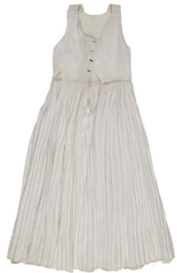
ERM 5078 (enne 1912)

Meeste särgid olid rahvarõivauurijate sõnul valgest linasest riidest sirgelõikelised tuunikad, millel olid pikad varrukad ja mahamurtud või püstkrae. 241 Kuna 19. sajandi hiiu särke on vähe säilinud, siis tuginetakse muudele allikatele, nt fotodele. 242 (Foto 3; joonis 10.) Hiiumaal kutsuti naiste särkideks Kesk-Euroopast pärinevat ja 13.