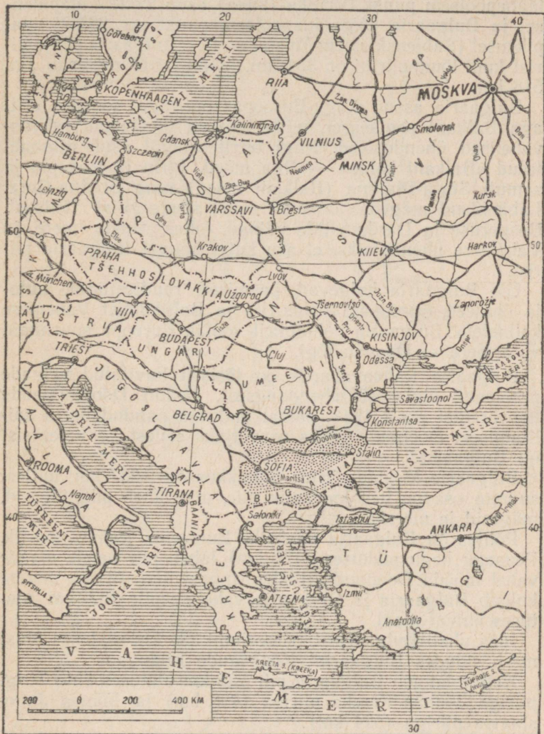
Bulgaaria geograafiline asend.