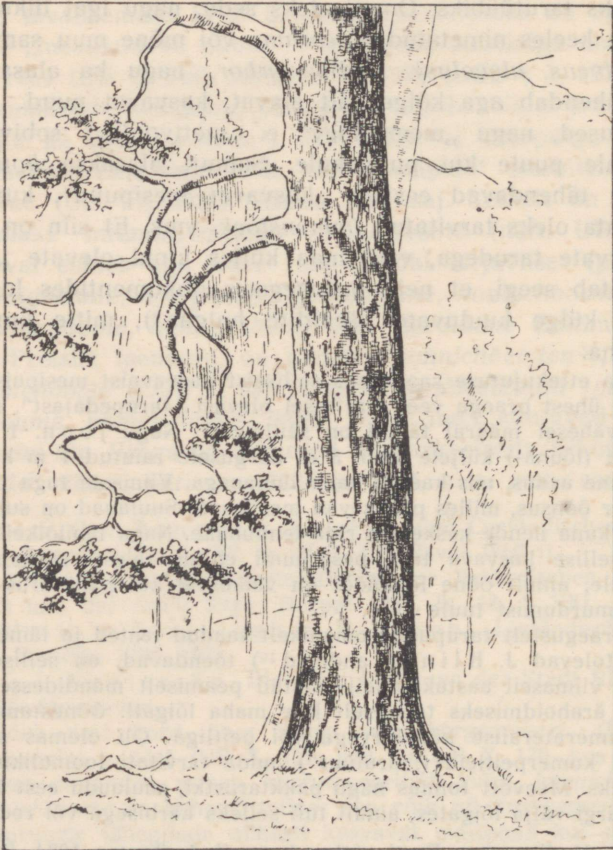
Joon. 1. Kasvav „tarupedajas“ Karula khk. Lõuna-küljelt. Autori ülevõtte järgi a. 1933.

ronida. Veel XIX saj. lõpupoolel oli metsamesinikel tarvitusel ka eriline ronimisnõõr, mida köideti ümber puu nii, et moodustus rida silmuseid, kuhu jalgadega toetudes saadi samm-sammult ülespoole ronida, kuni jõuti pesaruumi kõrguseni 11) . Kaitseks karude vastu, kes kippusid mesipuid lõhkuma, löödi tüvesse teravaid raudkonkse või riputati pesaruumi kohale puupakk, mis karu poolt eemale lükatuna tagasi kiikus ja kallaletungijale vastu pead löi. Klinge teatel olid XIX saj. lõpul Vastseliina pool