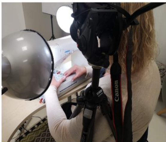
Joonis 1. Õmblemise filmimine

Väga oluliseks osutus filmimise käigus esineja kehaasend õmblemisel, sest arvestada tuli võttenurka, mis annaks video vaatajale edasi töö käigu õmbleja vaatepunktist – seega oli vajalik, et kaamera asetseks ligikaudu seal, kus õmbleja pea. Praktikas paiknes kaamera õmbleja pea kõrval vasaku õla kohal. Iste paigutati parimat võttenurka otsides mitme statiivi vahetusse lähedusse, mistõttu seda ei olnud võimalik liigutada – see nõudis juba õmblusmasina taha istumisel omajagu painduvust.