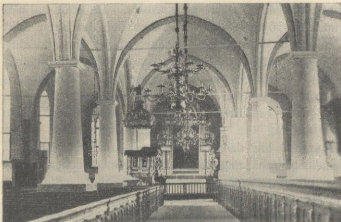
Interiör av tyska, förutvarande svenska kyrkan i Narva. (På golvet finnes på flera ställen gravstenar med svenska inskriptioner.)