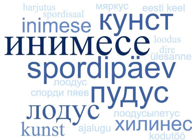
Joonis 4. Eestikeelsed sõnad poistel (v.a linnaosade ja koolide nimed)

Poisid kasutasid инимесе (4), spordipäev (3), кунст (3), лодус (3), пудус (3), kunst (2), inimese (2), хилинес (2), harjutus (1), ajalugu (1), лоодус (1), спорди пяев (1), loodus (1), лоодусыпетус (1), spordisaal (1), ülesanne (1), kodutöö (1), мяркус (1), spordisaal (1), dire (1), eesti keel (1).