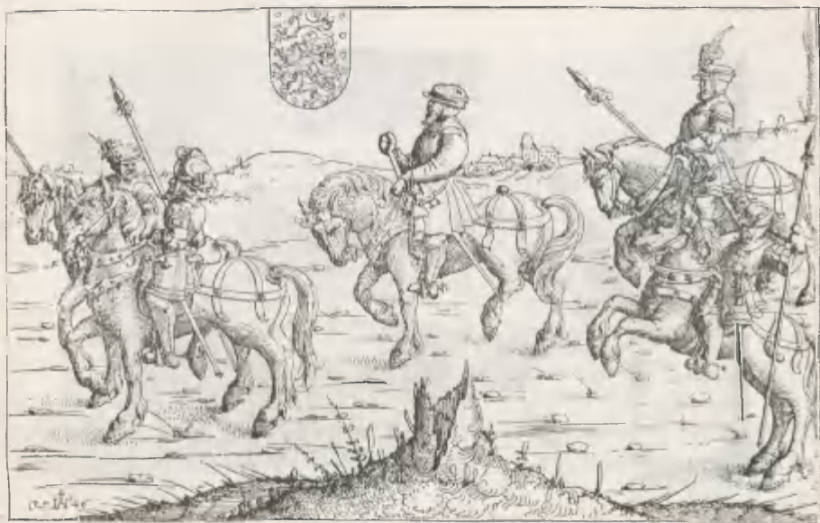
Fig. 2. Herberstain auf seiner Reise nach Dänemark im Jahre 1516. Verkleinerte Copie nach einem Kupferstich von A. Hirsfogel aus dem Jahre 1546.

1) Herberstain's Reise nach Dänemark im Jahre 1516, zu König Christian II. Breite des Stiches 275 mm, Höhe 175 mm.