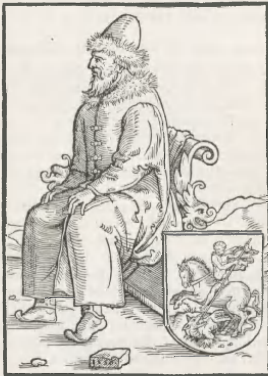
Fig. 5. Der Zar Basilius IV.

Ich bin der Reissen Herz vnd Khünig Meines Andlichen Erbs benuegtz Hab von nyembt nichts erbeyt noch gefhaufft Vm in namen Gottes ain Christ getaufft.