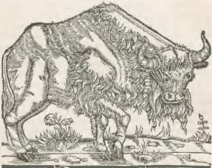
Fig. 7. Original-Holzschnitt des Bison aus Herberstein's deutscher „Moscovia“, Wien 1557.