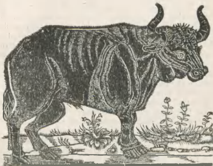
Fig. 8. Original-Holzchnitt des Ur aus Herberstain's deutscher „Moscovia“, Wien 1557.

»Der Suber weicht aber von dem (wildem) Ochsen bedeutend ab. Sein Kopf ist kurz, die Stirn sehr breit, die Hörner weit aus einander stehend und dann wieder (mit den Spitzen) einander zugewendet, zur Abwehr oder zum Kampf gerichtet; man hat so grofse gefunden, dafs drei grofse Männer dazwischen sitzen konnten.