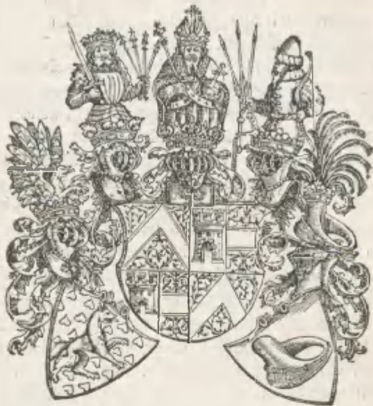
Fig. 6. Das mittelgroße Herberstain'sche Wappen. Verkleinerte Copie aus der deutschen „ Moscovia “ von 1557.

Pferdekummet. Siehe Fig. 6. Vergl. Adelung, H.'s Biographie, S. 439 ff., wo unrichtigerweise die Stellung der beiden Nebenschilde verwechselt ist. — Diese Form des Herberstain'schen Wappens erscheint hier in der deutschen Moscovia von 1557 zuerst und zwar auf dem vorletzten Blatte des Werkes*); sie kehrt später in einigen Publikationen H.'s wieder.