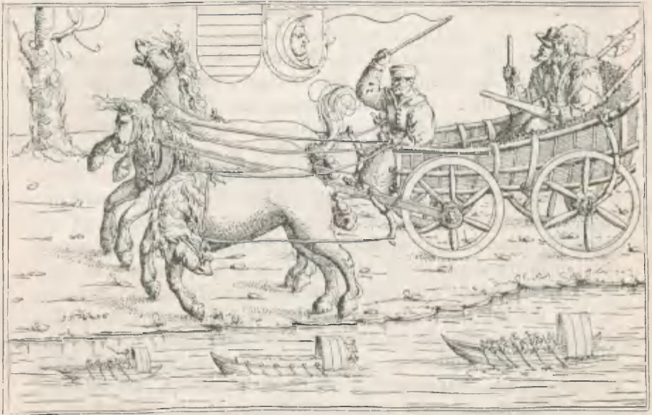
Fig. 4. Herberstain im „Kotschy-Wagen“ zwischen Wien und Ofen. Verkleinerte Copie nach einem Kupferstiche von A. Hirsfogel aus dem Jahre 1546.

3) Herberstain's Reisen nach Ungarn zum König Ludwig II. und zum Sultan Soliman. Bei Bartsch, a. a. O., No. 21: »Deux hommes dans un chariot attelé de trois chevaux l'un à coté de l'autre« etc. Oben das ungarische und das türkische Wappen, von Bartsch erwähnt, aber nicht erklärt. Unten links das Monogramm des Künstlers in der Jahreszahl 1546. Siehe Fig. 4. Breite des Stiches 275, Höhe 176 mm. Stark verkleinert im Holzschnitt wiedergegeben auf dem