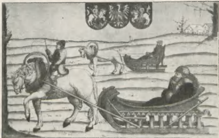
Fig. 3. Herberstain im Schlitten auf einer seiner Reisen nach Rußland. Verkleinerte Copie nach einem Kupferstiche von A. Hirsfogel aus dem Jahre 1546.

2) Herberstain's Reisen nach Rußland 1517 und 1526. Auf diese bezieht sich der von Bartsch a. a. O. unter Nr. 20 angeführte Kupferstich, den er mit folgenden Worten beschreibt: »Un homme dans un traineau attelé d'un seul cheval monté par un palefrenier. Un autre traineau se voit au milieu du fond« etc. Die