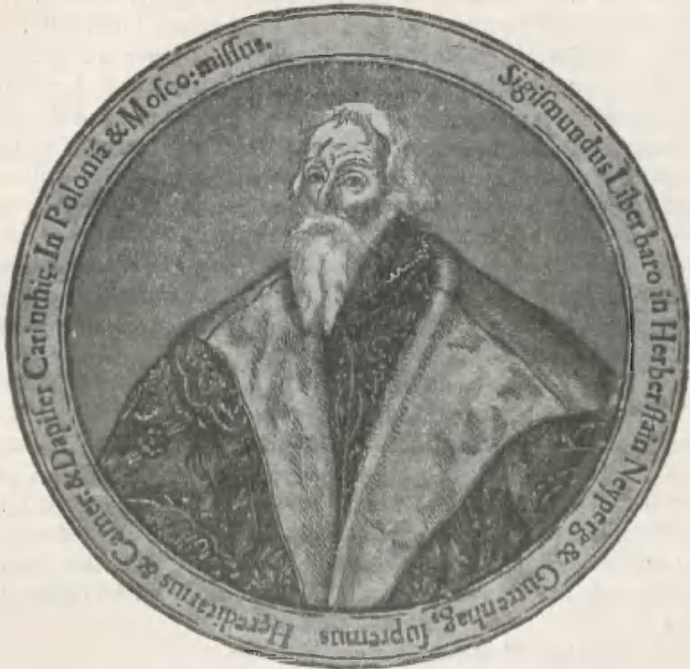
Fig. 1. Herberstein's Brustbild aus dem Jahre 1558.

an sein Lebensende (1566) hat H. stets neue Veröffentlichungen über seine Reisen, seine sonstigen Erlebnisse und seine Familie erscheinen lassen. Er hatte in seinen alten Tagen offenbar seine besondere Freude an diesen Veröffentlichungen, und wenn dabei etwas Eitelkeit mit im Spiel war, so erscheint dieses leicht ver-