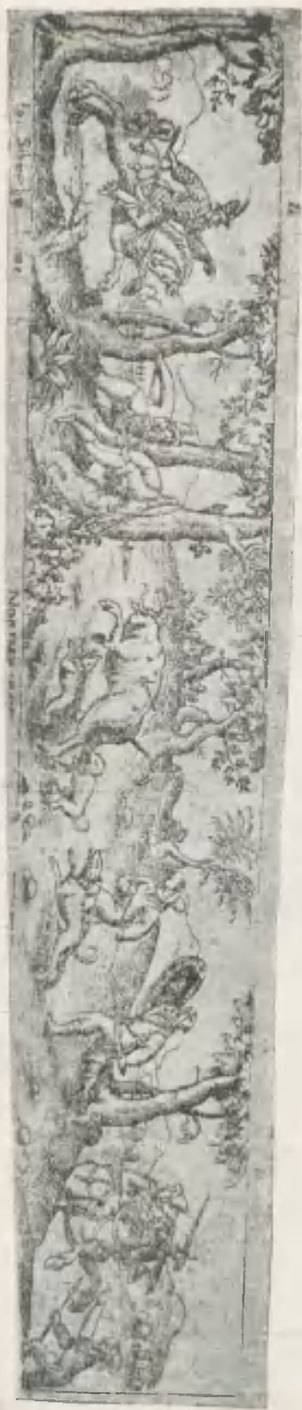
Fig. 10. Sibmachers Kupferstich einer Urstier-Jagd, aus dem Jahre 1596. Photograph. Copie.

gelebt hat. Näheres findet man in meinem oben citierten Aufsätze.