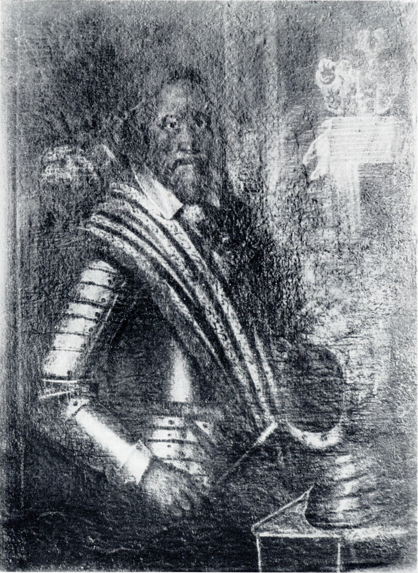
HANS WRANGEL, FRIHERRE TILL LUDENHOF, Överste och lantråd. (1588—1667).