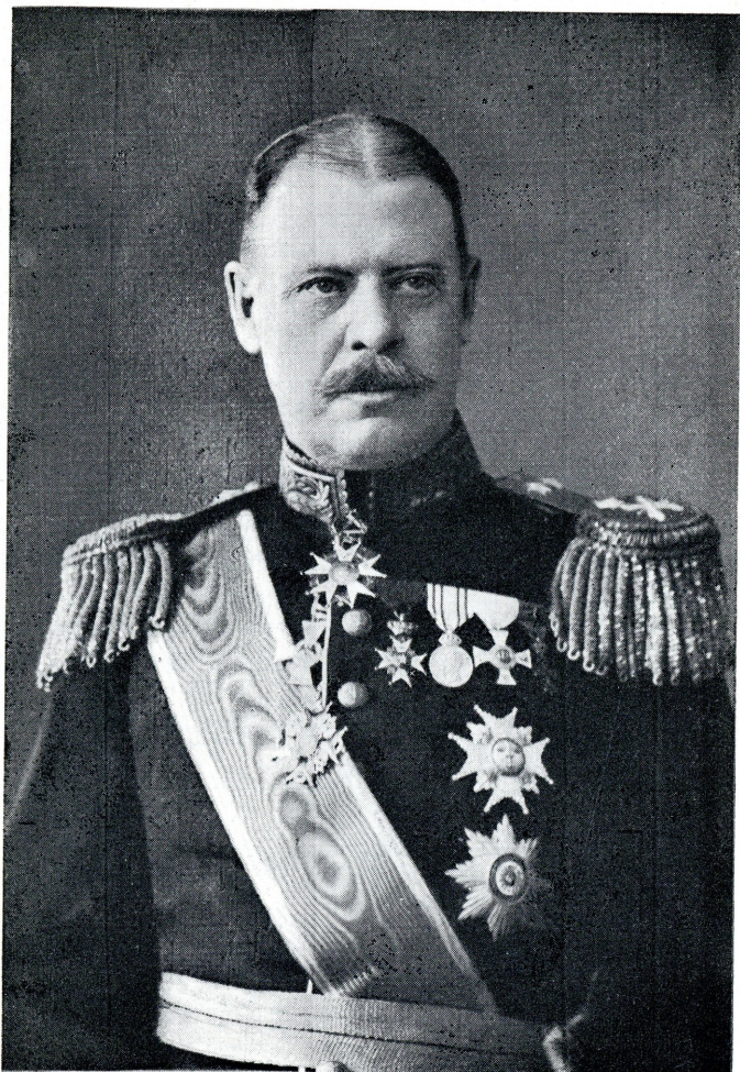
GENERALLÖJTNANT HERMAN WRANGEL