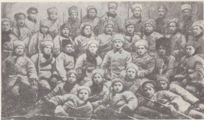
Eesti kommunistlike väeosade komandöride kursuste lõpetajaid 1918. aastal

kohustati saatma ettenähtud arvu mehi. Kursustele võeti kommuniste või neid, kellel oli kahe parteiliikme soovitus ja kes olid vähemalt 6 kuud sõjaväes teeninud. Kursuste kestus oli ette nähtud kõigest 3 nädalat, sest võitlus Eesti vabastamise eest ei lubanud sellele rohkem aega pühendada.