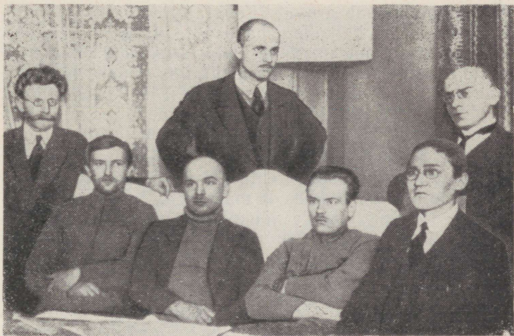
Eesti Tööraha Kommuuni Nõukogu.