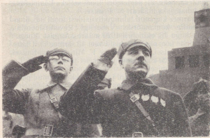
K. Vorošilov ja A. Kork võtavad Moskvast 1934. aastal vastu paraadi