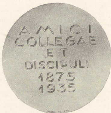
Ludvig Puusepp'i pronksmedal, münditud tema 60-aastase sünnipäeva puhul.