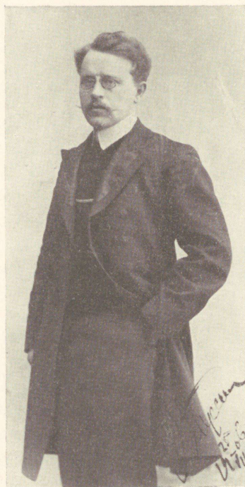
Ludvig Puusepp Peterburis 1906.