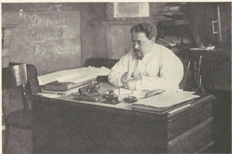
Ludvig Puusepp Peterburis oma kabinetis haiglas umb. Maailmasõja päevil.