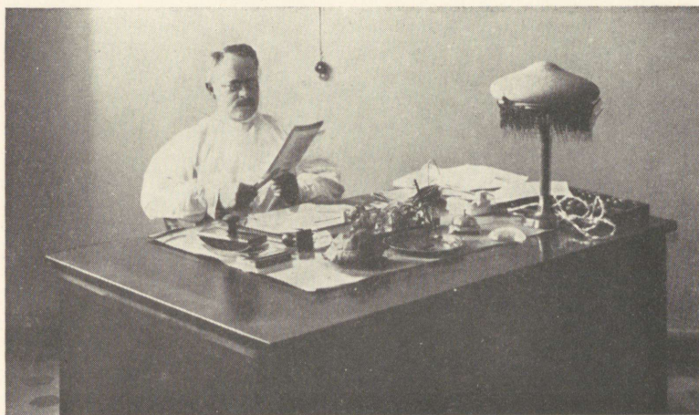
Ludvig Puusepp Tartus oma kabinetis Närvikliinikus selle asutamise aastal 1921.