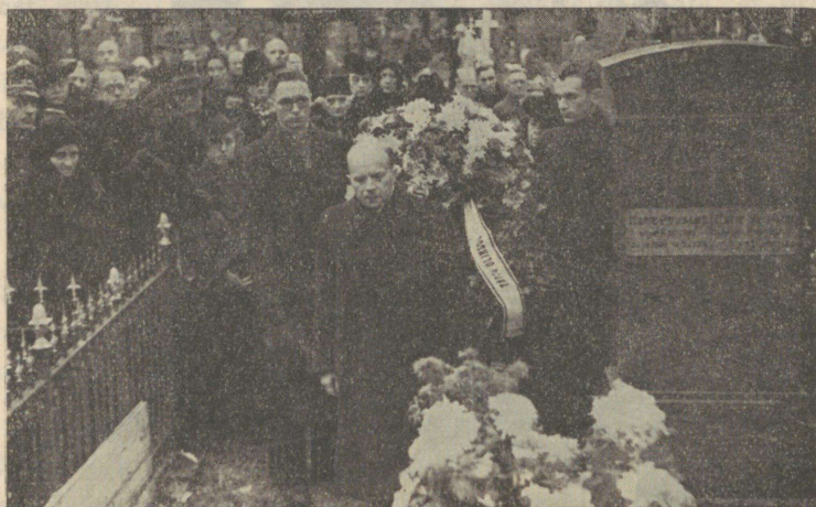
Rektor prof. E. K a n t järelhüüet ütlemas L. P u u s e p p'i haul.