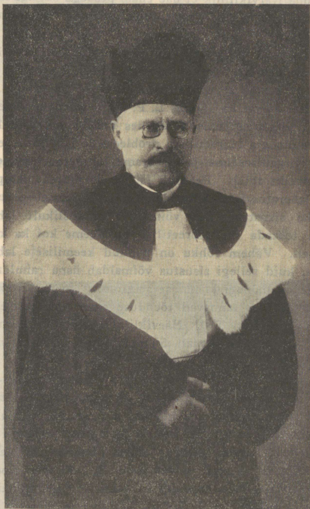
Ludvig Puusepp Padova Ülikooli audoktorina.