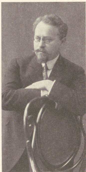
Ludvig Puusepp Peterburis umb. 1909.