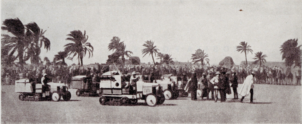
Ekspeditsioon roomikautodel Uarglas

G. M. HAARDT — L. AUDOUIN-DUBREUIL HELGE KAARSBERG / WILHELM VOLZ