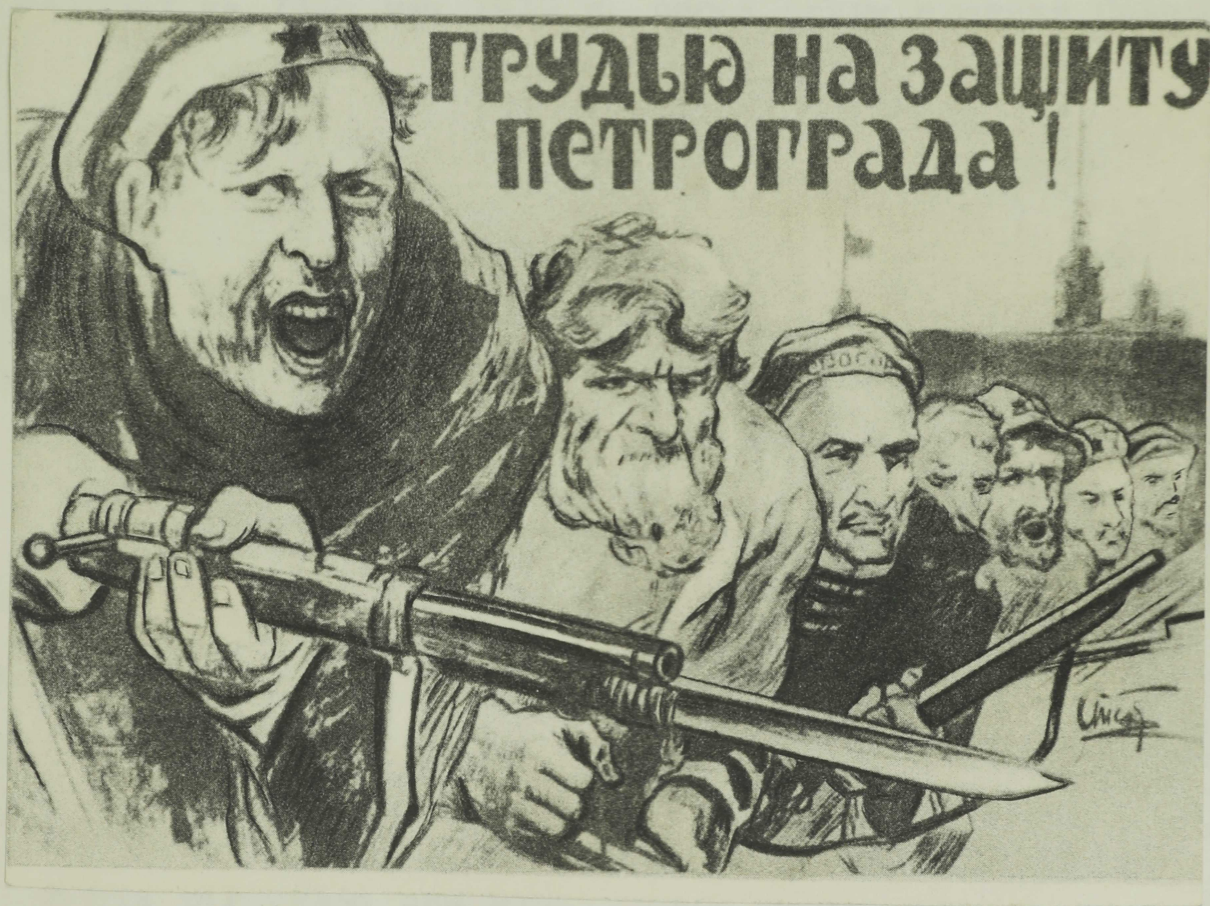
ПЛАКАТ ПЕРИОДА НАСТУПЛЕНИЯ ЮДЕНИЧА НА ПЕТРОГРАД В 1919г.

"Все на защиту Петрограда!", "Все на разгром внешней и внутренней контрреволюции!", "Не допустим, чтобы окопавшиеся в Петрограде враги помогли бандам Юденича!" - таковы были лозунги, звучавшие в те дни среди рабочих и красноармейских масс.