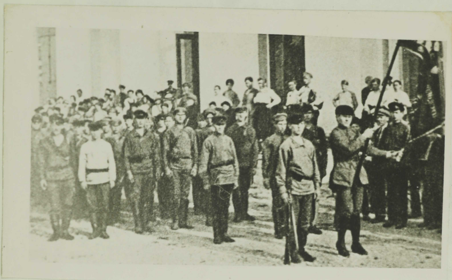
ОТРЯД ПЕТРОГРАДСКИХ КОМСОМОЛЬЦЕВ, ОТПРАВЛЯЮЩИХСЯ НА БОРЬБУ С ЮДЕНИЧЕМ ЛЕТОМ 1919 г.

Не отставали от коммунистов и комсомольцы. Решением I-й Петроградской конференции РКСМ на фронт было мобилизовано 10 процентов состава комсомольской организации.