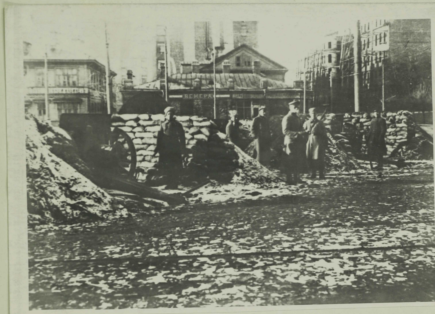
Укрепления на улицах Петрограда в дни наступления Юденича.

По всем районам города была создана артиллерийская оборона. На важнейших площадях и улицах было установлено 57 орудий, причем 7 из них было установлено на специально оборудованных трамвайных и железнодорожных платформах.