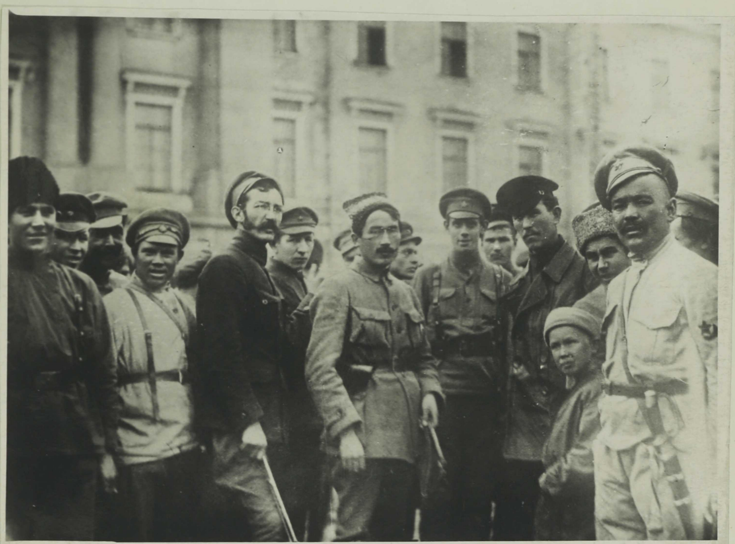
Комсостав Башкирской дивизии, сентябрь 1919 г. г. Петроград.

Части башкирской дивизии в сентябре 1919 г. были переброшены в Петроград.