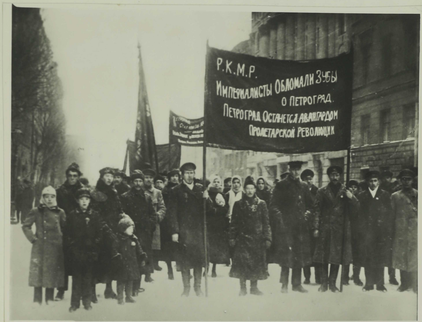
— Демонстрация трудящихся г. Петрограда — после разгрома Юденича. Декабрь 1919 г.

Героическая оборона Петрограда закончилась полной победой ее защитников.