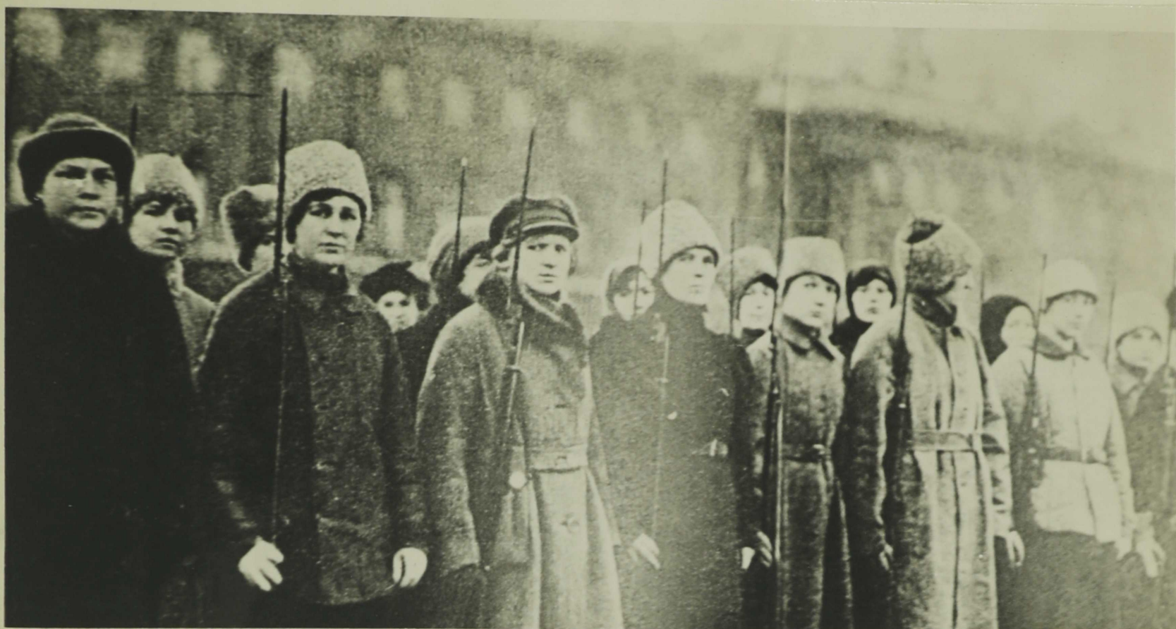
ЖЕНЩИНЫ-ДОБРОВОЛЬЦЫ, ОТПРАВЛЯЮЩИЕСЯ НА БОРЬБУ С ЮДЕНИЧЕМ.

Об активном участии женщин-работниц в защите родного города красноречиво свидетельствует такой факт. После того, как белые заняли Красное Село, несколько работниц предложили советскому командованию послать их в разведку. Под видом местных крестьянок они проникли в Красное Село и выяснили численность и расположение вражеских войск, их вооружение. Несколько дней они почти ничего не ели, ночевали в лесу. Собрав необходимые сведения, они благополучно вернулись и сообщили ценные сведения в штаб.