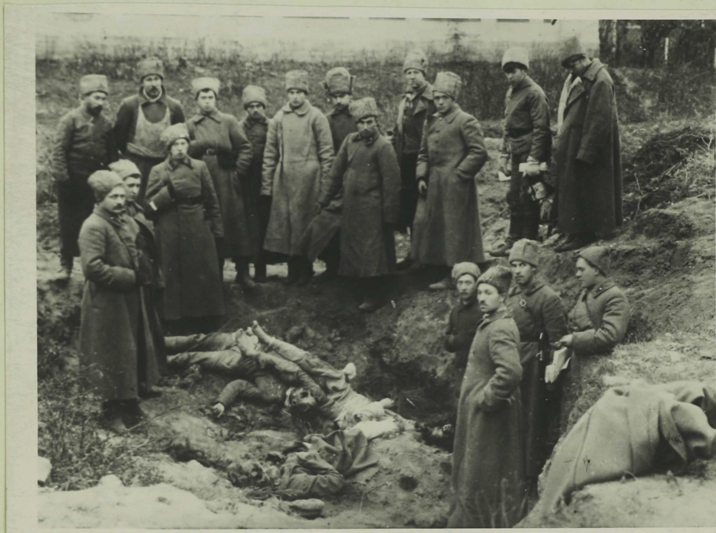
Трупы растрелянных белогвардейцами Юденича красноармейцев в г. Нарве осенью 1919 г. 12.

долгу и выдать военную тайну. Эти зверства свидетельствовали о бессильной злобе белых за поражения.