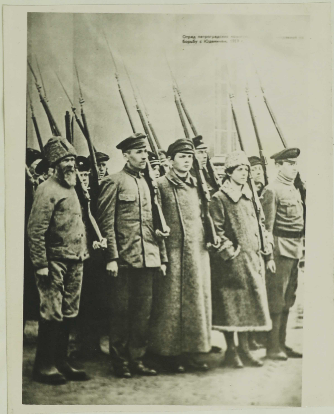
ОТРЯД ПЕТРОГРАДСКИХ КОММУНИСТОВ МОБИЛИЗОВАННЫХ НА БОРЬБУ С ЮДЕНИЧЕМ.

22-го мая Петроградский Совет обратился к питерским рабочим: "Враг посягает на Красный Питер - столицу мировой революции. Рабочие Петрограда, станьте на защиту вашего города!. К вам придут трудящиеся всей Советской России!" I.