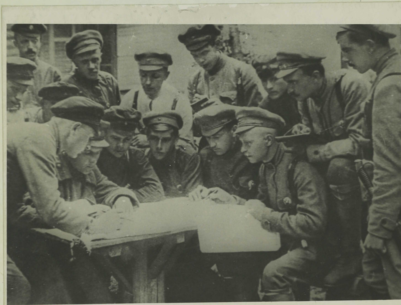
ШТАБ КОМСОМОЛЬСКОГО ОТРЯДА НА ПЕТРО- ГРАДСКОМ ФРОНТЕ.

В то же время на фронте 7-й армии противник усилил сопротивление, переходя в контратаки с целью вернуть Красное Село и Детское Село. Местами даже противник потеснил наши войска.