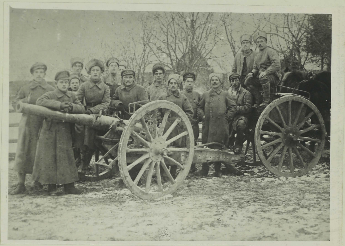
Ноябрь 1919 г. Деревня Малышева Гора. У орудия, взятого у частей армии Юденича.

В день 2-й годовщины Октября части 10-й стрелковой дивизии 15-й армии после упорных боев освободили город Гдов, где было взято до 750 пленных, 12 пулеметов, 4 орудия.