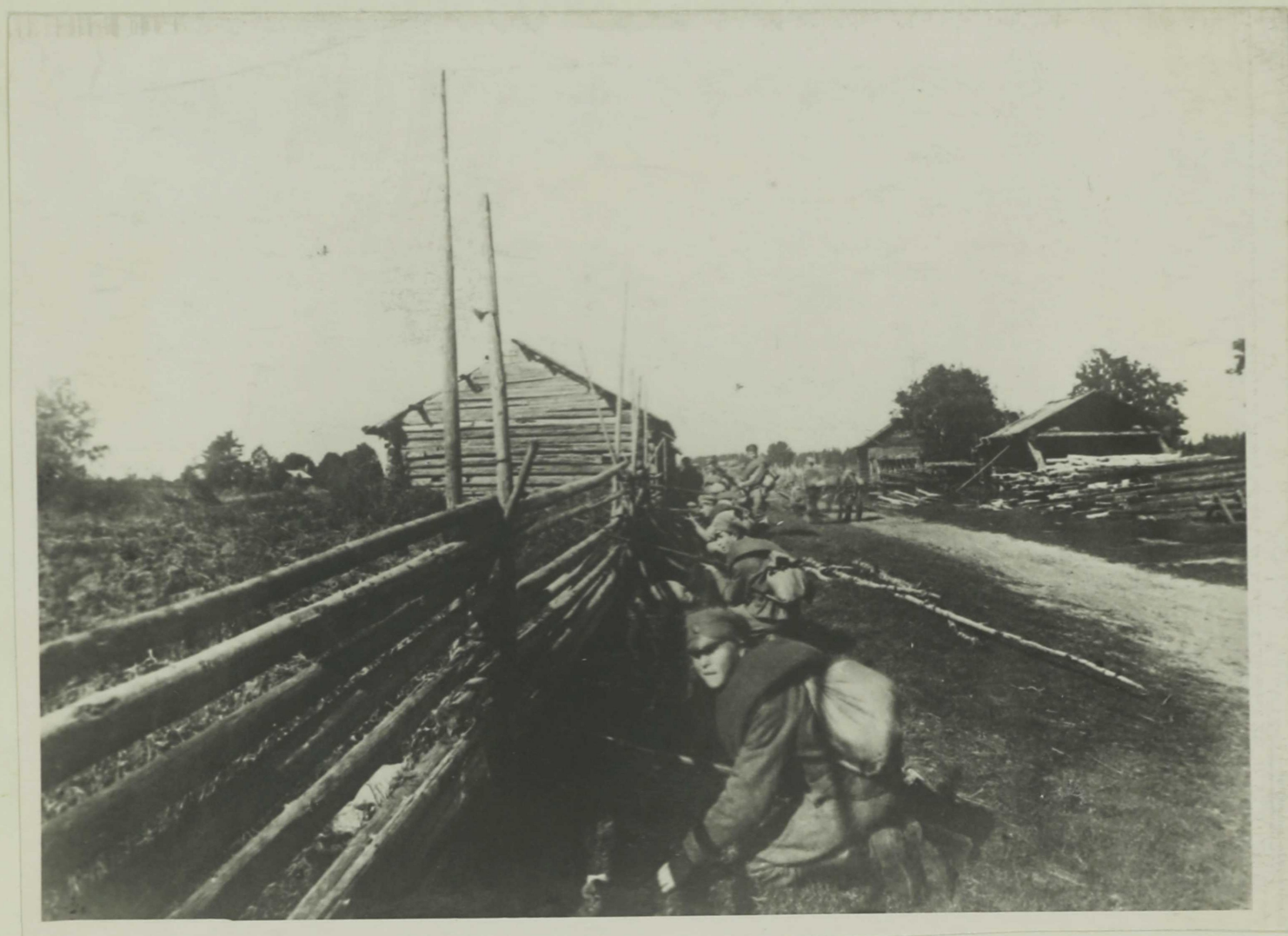
6 е курсы на Ямбургском направлении летом 1919 г.

" Среди этих подкреплений были отряды коммунистов и курсантов, которые, нужно отдать им справедливость, сражались хорошо!" I.