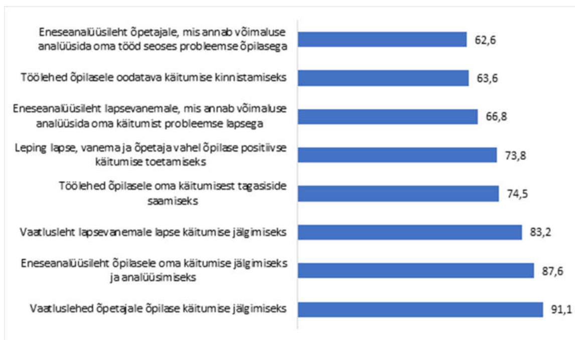
Joonis 1. Ootused juhendmaterjalis esitatavatele lisamaterjalidele (protsentides).

Esitatud väitega, kas käitumise tugikava juhendmaterjal peaks sisaldama vormi tugikava dokumenteerimiseks, oli nõus või pigem nõus 625 vastajat, mis on 94,7% kogu vastajate hulgast. 35 ehk 5,3% vastanutest avaldasid arvamust, et etteantud vorm on ebavajalik.