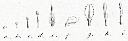
Pubatilla albana β.