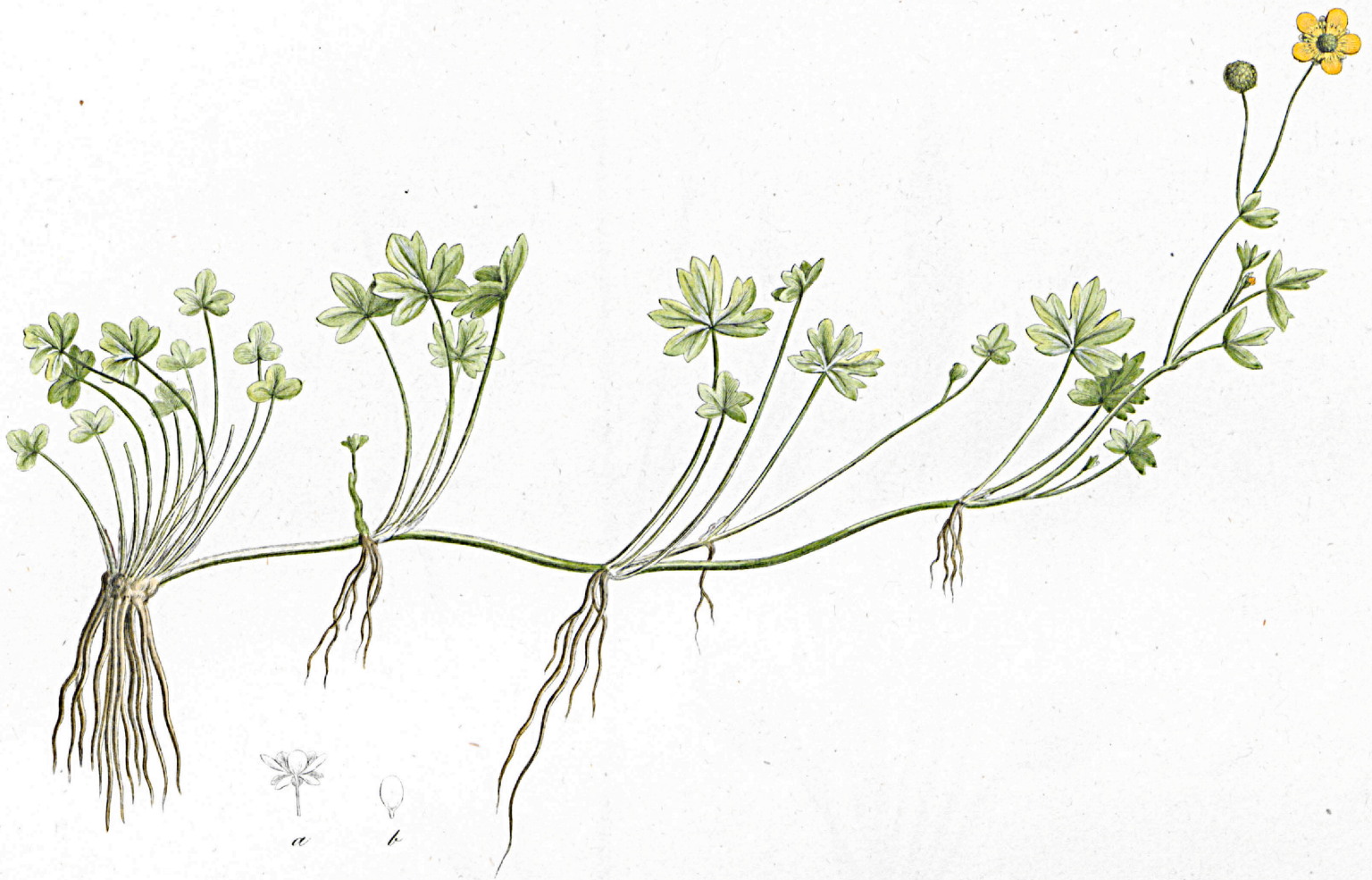
Ranunculus radicans .