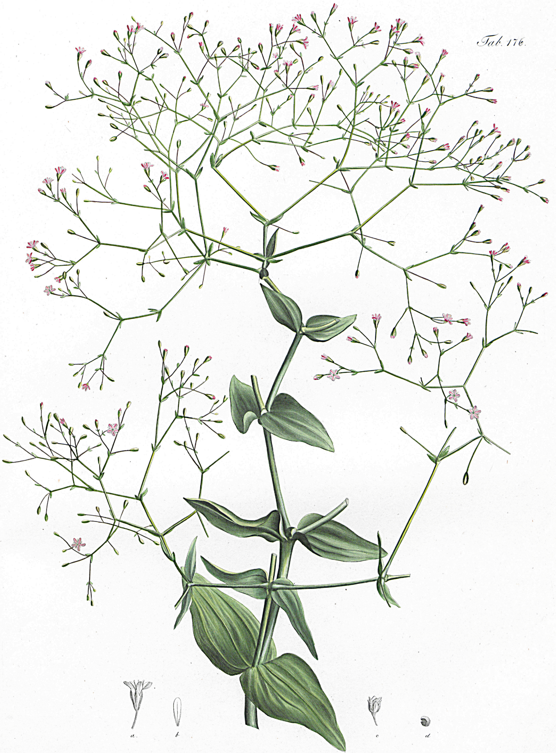
Gypsophila perfoliata \beta . tomentosa .