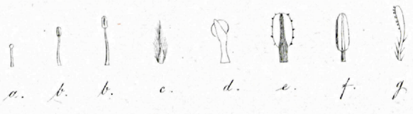
Pulsatilla Bungeana .