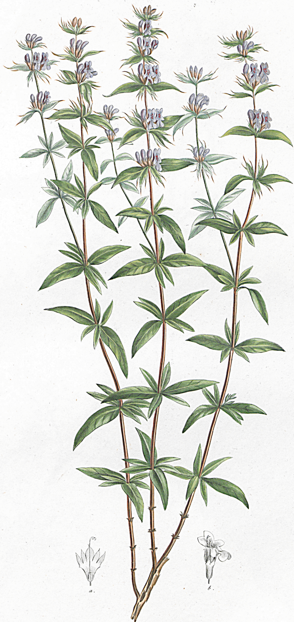
Dracocephalum integrifolium .