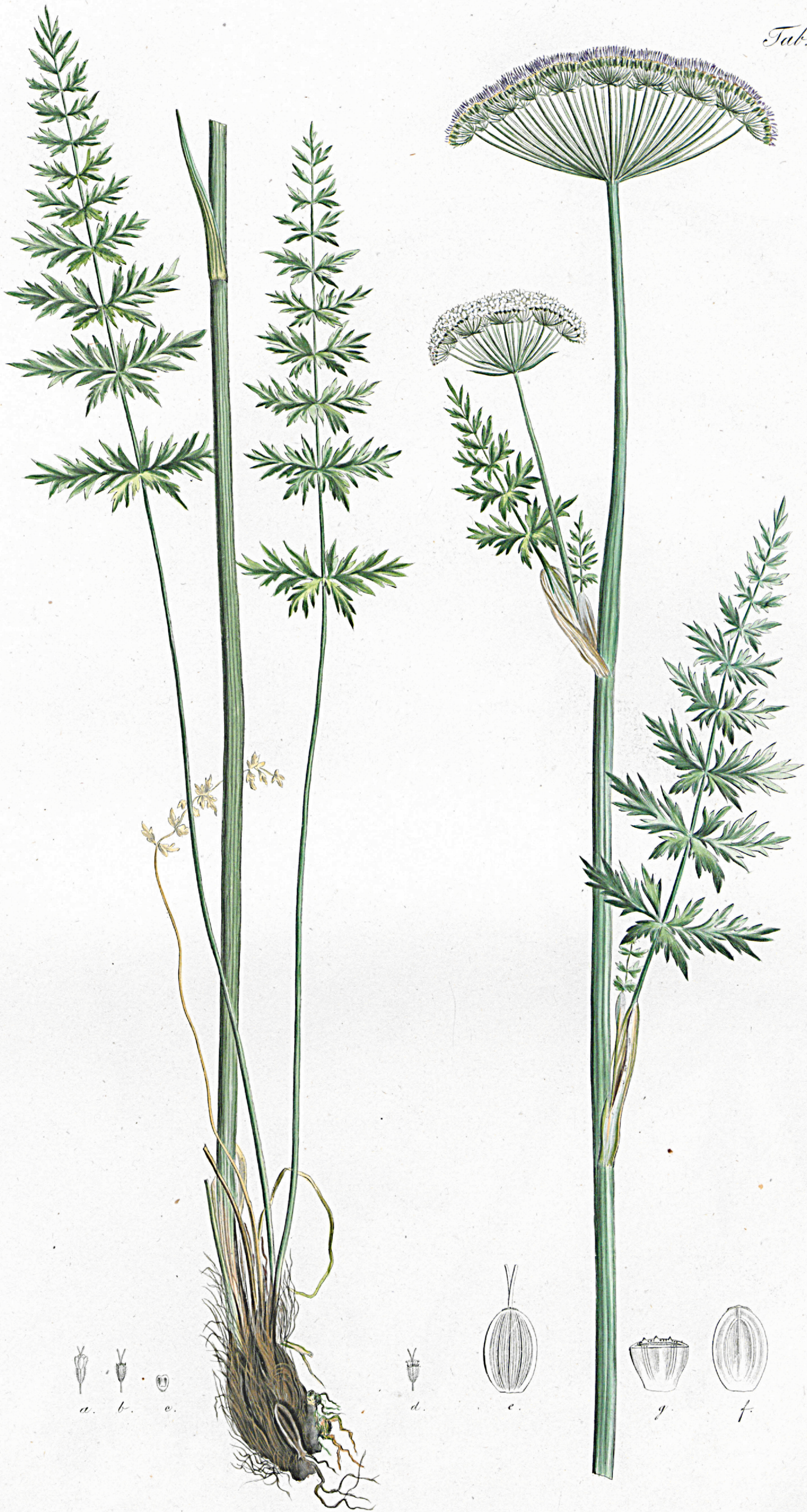
Athamanta condensata .