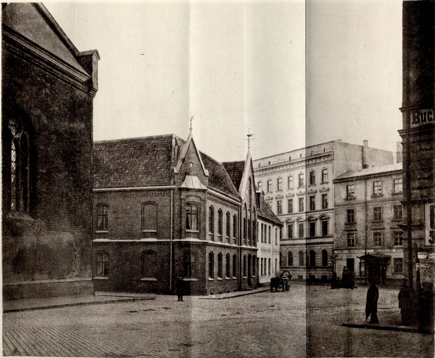
C. Schulz, Lichtdruckerei, Riga.

Der Herderplatz nach Niederlegung des Diakonathauses 1887, vom Komplatz aus gesehen.