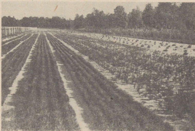
Joonis 1. Alaline taimla-puukool Läänemaa metsamajandi Riguldi metskonnas kehvadel liivmullal, kus nõuete kohase väetamise ja hooldamise tulemusena okaspuutaimed on hästi arenenud. Vasakul standardsed kaheaastased männiseemikud.

Metsakultuuride kasvamine ja arenemine sõltub kasutatava istutusmaterjali kvaliteedist. Vähearenenud ja kidurate taimedega istutatud metsakultuurid umbrohtuvad kergesti ning on vähe vastupidavad haigustele ja kahjuritele. Nõrkade taimedega istutatud kultuur jääb tihti