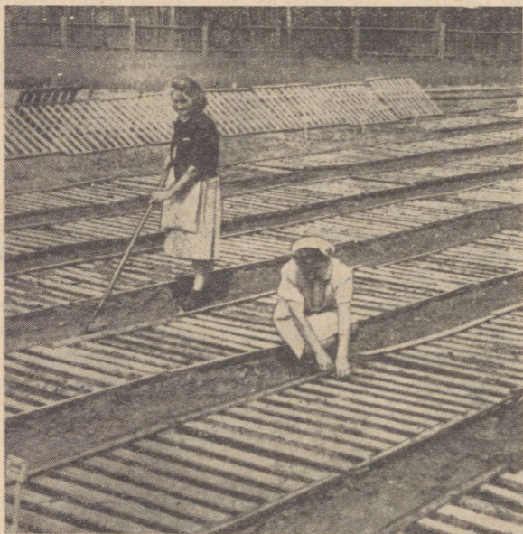
Joonis 4. Taimeridade vahede katmine laudadest kilpidega Suure-Jaani metsamajandi Kabala metskonna taimlas. Tagapool näha kuusetõusmete varjutamiseks peenarde kohale ( 45^\circ nurga all) asetatud kilbid.

tab see kuusesemikute kasvu. Vastavad tähelepanekud näitavad, et reavahede katmine vähendab külmakohrutust . Kohrutuse läbi mullast väljakerkinud taimede arv on kaetud peenardel 6—8 korda väiksem kui katmata peenardel.