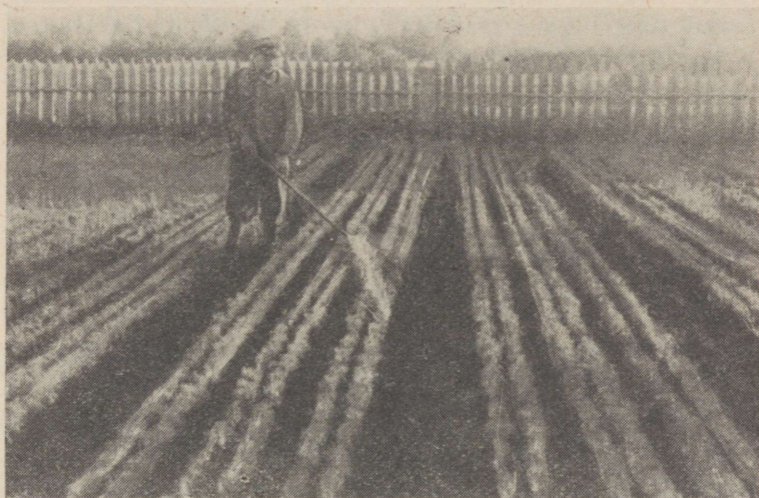
Joonis 2. Männiseemikute profülaktiline pritsimine bordoo vedelikuga (Valgamaa metsamajand, Taagepera metskond).

Tallinna metsamajandi metskondades. Granosaan nagu kaaliumpermanganaatki tõusmetele kahjulikku mõju ei avalda, vaid mõjub isegi stimuleerivalt seemne idanemisele.