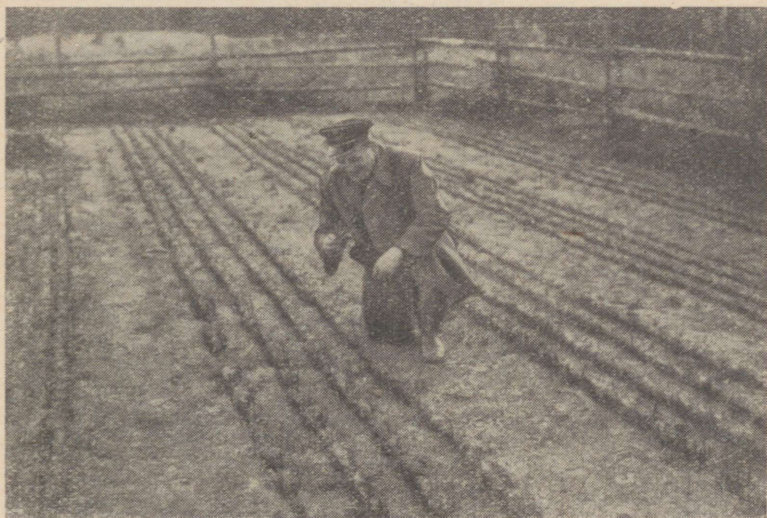
Joonis 3. Ühtlaselt tärganud männikylv Roela mets- konna ajutises taimlas.

Kõigi agrotehniliste reeglite kohaselt haritud taimlas võib küllaldaselt hulgal standardsete seemikute väljatule- kut arvestada sel juhul, kui taimed asuvad külvi- reas paraja tihedusega ja ühtlaselt. Optimaalse külvitiheduse leidmine pole sugugi lihtne. See ei olene ainuüksi puulii-