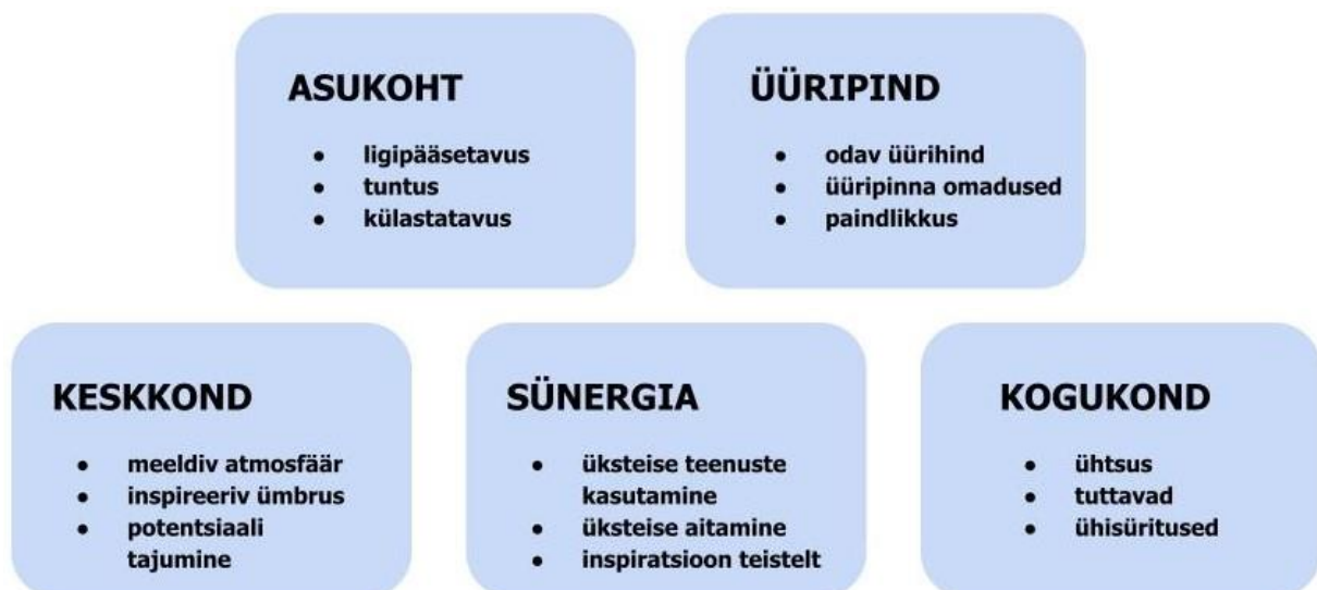
Joonis 6. Intervjuude põhjal moodustunud teemad koos alamteemadega

Ettevõtjate intervjuude temaatilise analüüsi kaudu selgitan ettevõtjate asukohavalikute põhjuseid. Järgnevalt toon ära intervjuude tulemused teemade kaupa (joonis 6). Teemade juurde olen lisanud alamteemad. Lisaks toon välja Aparaaditehase tegevjuhtide arvamuse ettevõtjate asukohavalikute põhjustest.