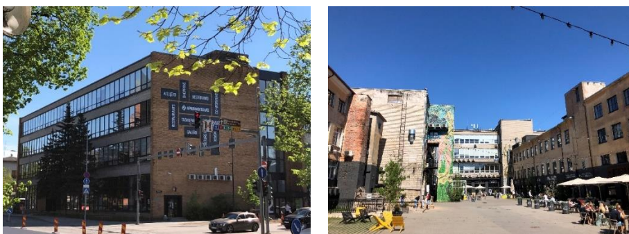
Joonis 4 ja 5. Aparaaditehase hoone Riia ja Kastani tänava nurgalt vaadatuna; Aparaaditehase hoov Riia tänava suunas