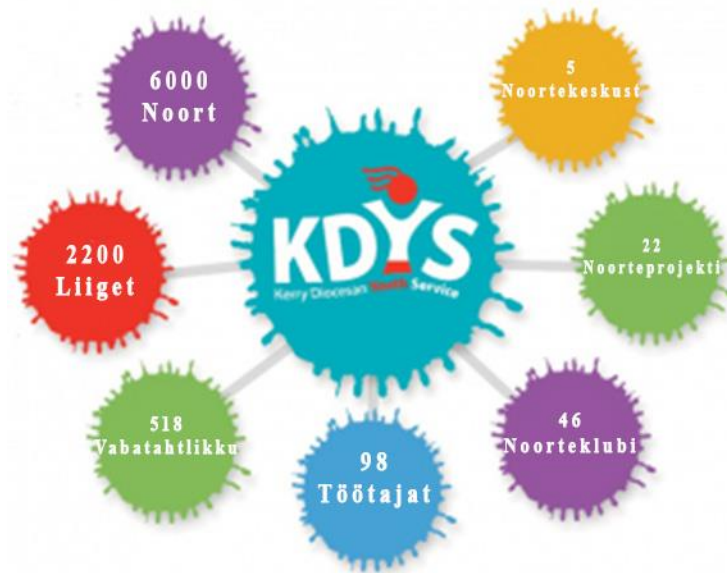
Joonis 3. KDYS struktuur (isiklik kommunikatsioon: Gareth, Iirimaa; töö autori tõlge)

Joonis 3 saab näha KDYS ülevaadet 2022. aasta seisuga. 2022 aastal oli KDYS is 5 noortekeskust, 22 noorteprojekti, 46 noorteklubi, 98 noorsootöötajat (töötajat), 518 vabatahtlikku, 2200 liiget ja KDYS aitas ja toetas 6000 noort.