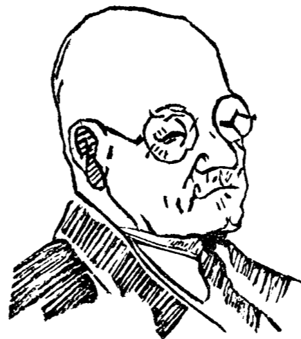
Депутатъ русск. фракціи Госуд. Собранія В. Г. Григорьевъ.

Депутата русск. фракціи Госуд. Собранія В. Григорьева защищали прис. повѣр. г. Штрандманъ и г. Сорочкинъ.