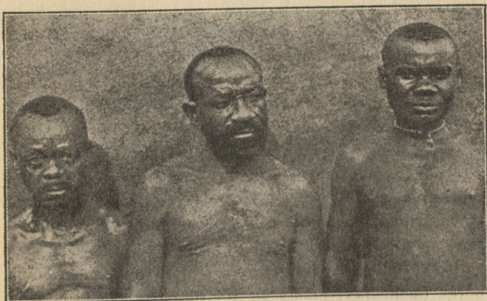
Ituri-pügmeed Ituri jõekonnast, Kongost.

Armuline oli mu isa meile: heldesti päästis ta meie paadi. Yamana (P. Koppers).