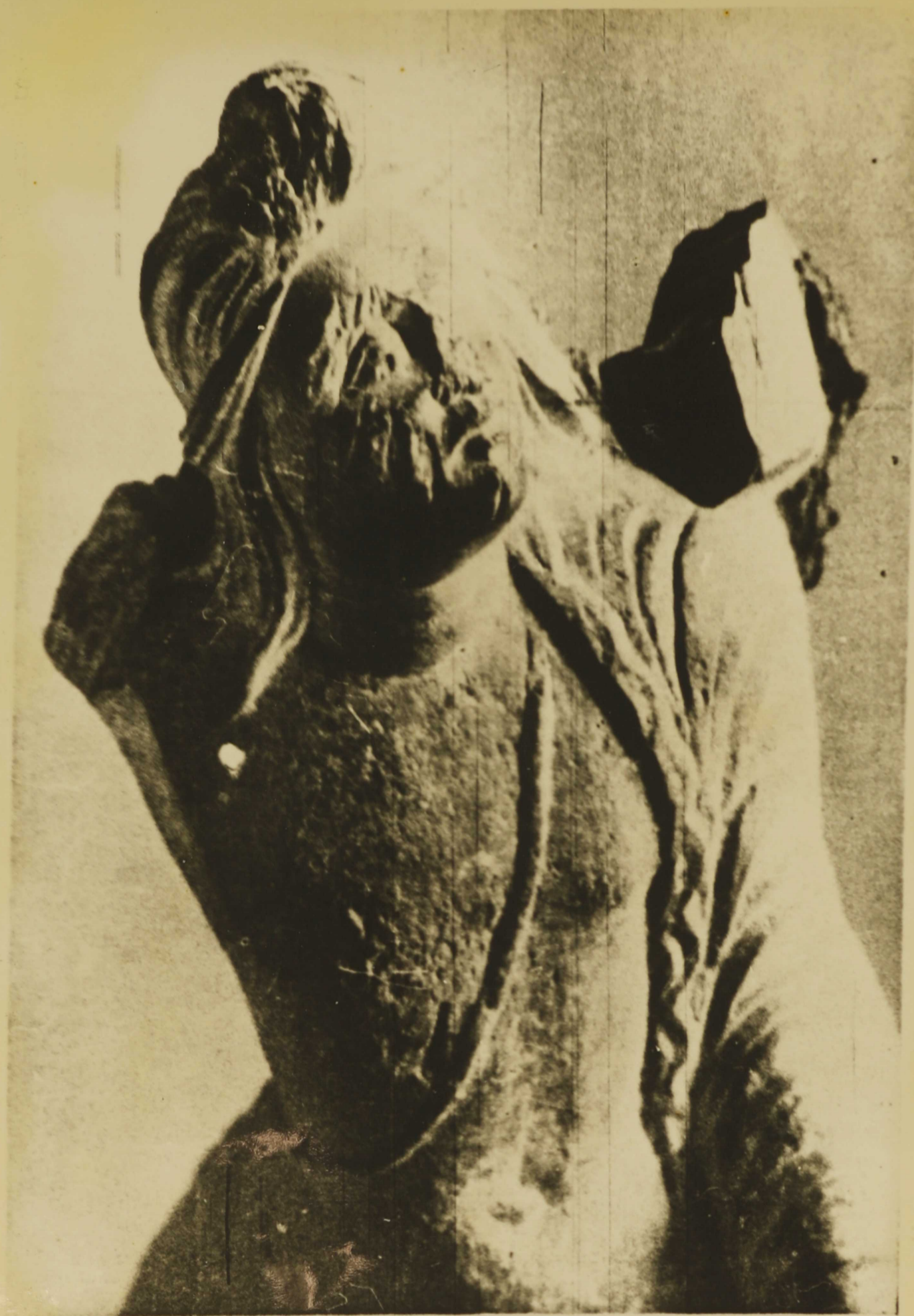
Табл. 17. Терракотовый рельеф из Беграма. Собрание Музея искусств узбекистана (Ташкент)