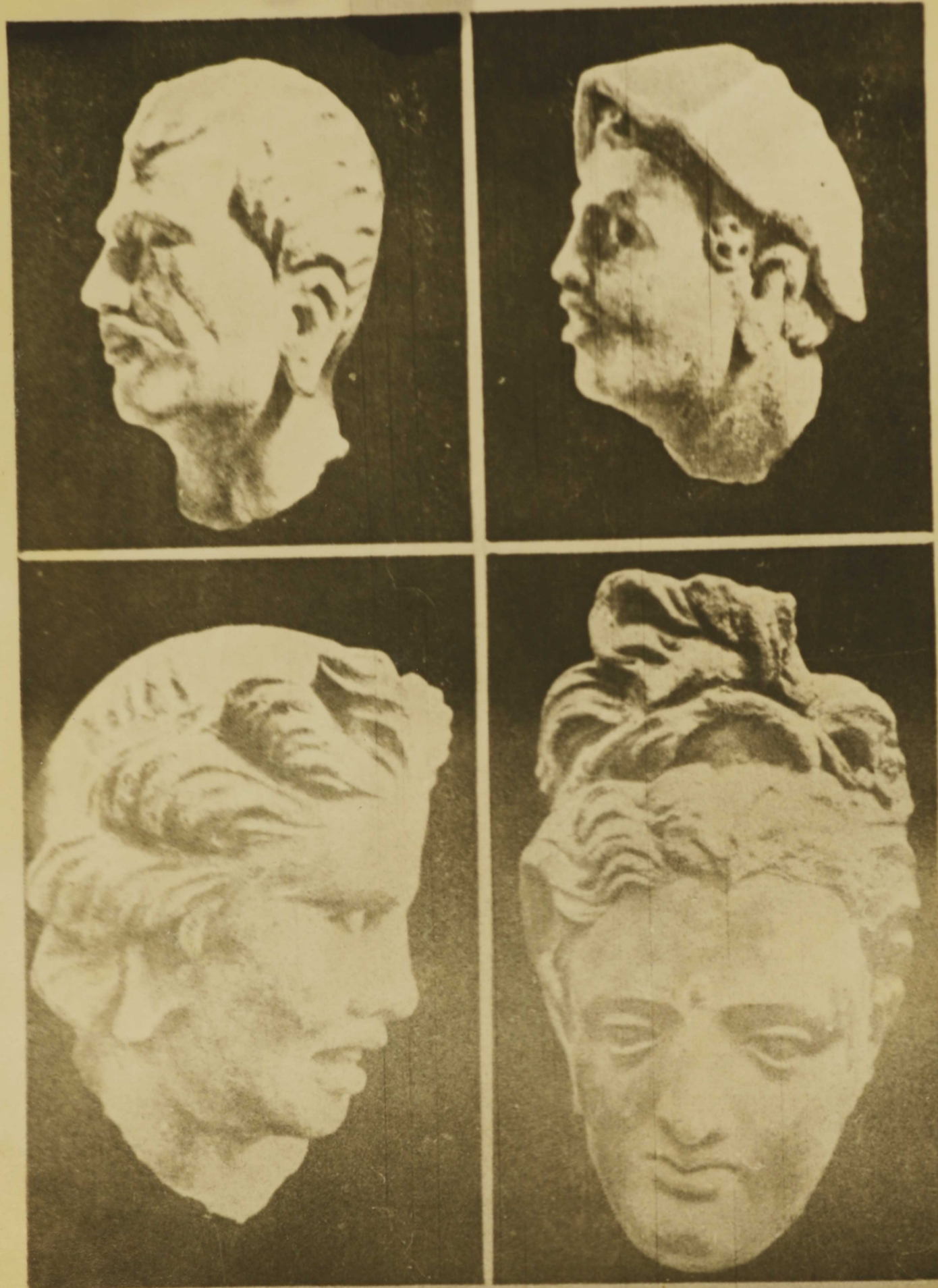
Табл. 18. Хадда. Голова болисатвы и головы «варваров»