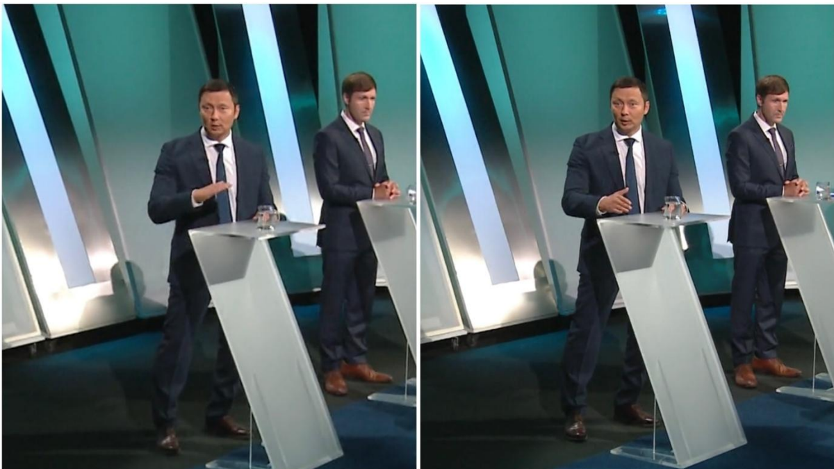
Kollaaž 3. Mihhail Kõlvart teeb käega tõrjuva liigutuse, öeldes “no way”. (Allikas: “Esimene stuudio” / ETV, 2024).

Poliitikul on saates läbivalt neutraalne ilme ning silmapaistvaid kulmuliigutusi pole võimalik tuvastada. Korra tuleb Kõlvartile siiski naer peale, ent siis varjab ta seda maha vaadates. Enda kõnevooru ajal vaatab ta peamiselt saatejuhte, ent vahepeal hetkeks kaamerasse ja kaugusesse. Muul ajal seisab poliitik enamasti enda vastas oleva oponendi suunas ning vaatab parasjagu kõnelejat. Kõlvarti hääletoon oli debati esimeses pooles rahulik ja hiljem pisut emotsionaalsem. Tema lausetes ilmneb ka tuntav rütm, eriti hetkeil, mil Kõlvart kordab lauseosi. Üldiselt jäi olenemata debati tulisusest Kõlvart saadetes läbivalt rahulikuks.