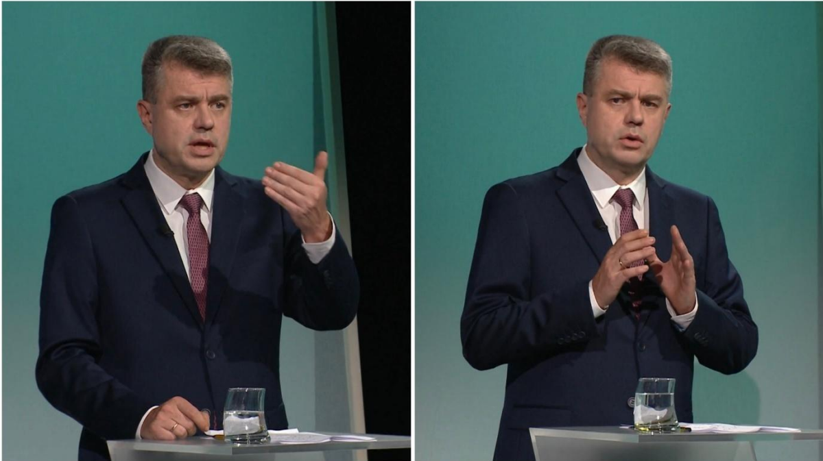
Kollaaž 2. Urmas Reinsalu käeliigutuste süsteem.

konkreetne ja emotsionaalne ning sealjuures rõhutab ta sõnu mitte intonatsiooni, vaid hääle valjususega. Reinsalu räägib pigem kiires tempos, kohati on eristatav ka rütm. Tema rääkimise tempo kiireneb eeskätt siis, kui vastused lähevad pikemaks ja ajapiirang seetõttu rõhuvamaks. Poliitiku mitteverbaalne käitumine debati alguses ja teises pooles erineb märkimisväärselt – kui alguses küsib poliitik sõna, hakkab ta hiljem saatejuhtidest üle rääkima ning võib oponentidele vahele segada. Samuti muutub ta debati jooksul ilmekamaks ning hakkab rõhutama rohkem sõnu.