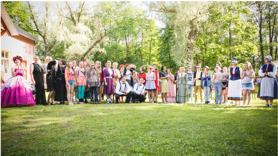
Foto 8. Moetenduse „Hääde meeste naised läbi aegade“ modellid.