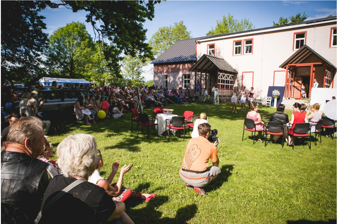
Foto 7. Moetenuse toimumiskoht ja vaatajaskond.