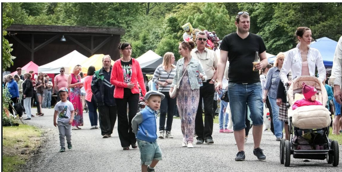
Foto 2. Laadamelu.