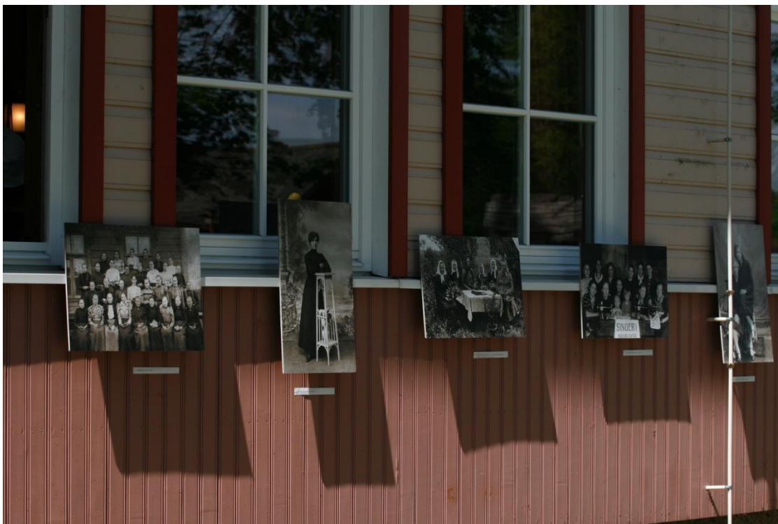
Foto 1. Fotonäitus „Häide meeste naised läbi aegade“ seltsimaja seinal.