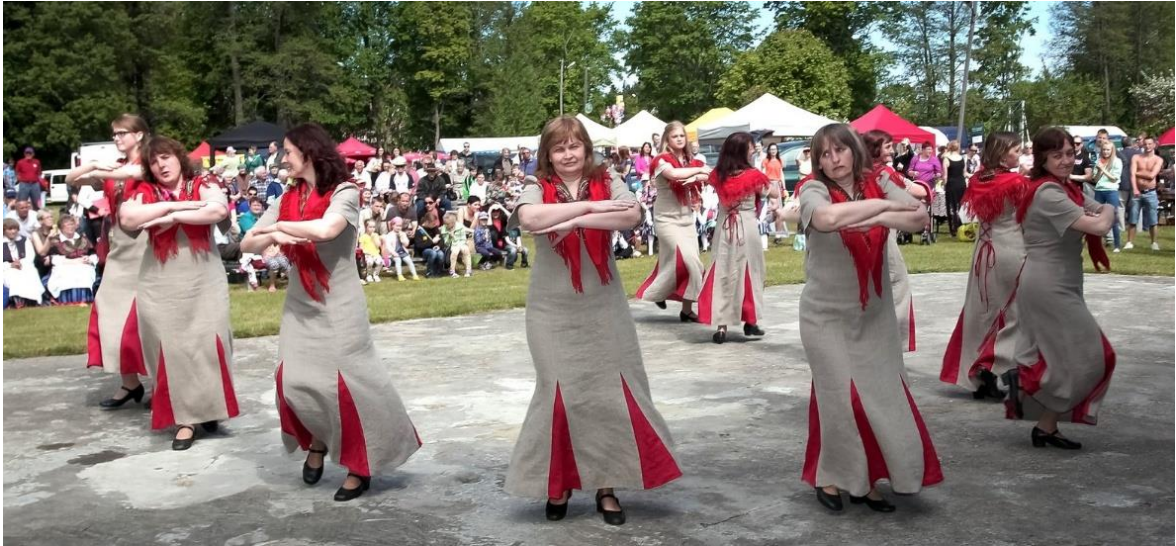
Foto 5. Kontserteeskava, esineb Kabli naisrahvatantsurühm.