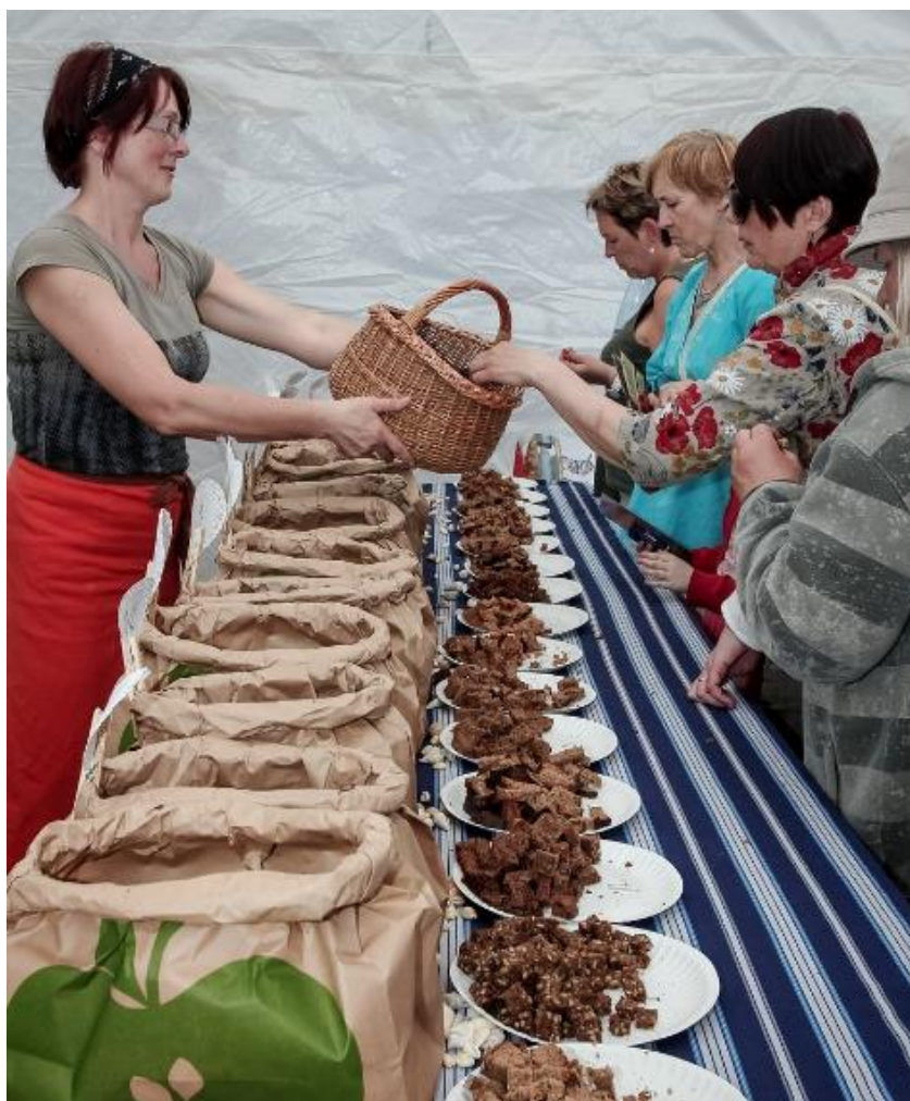
Foto 4. Koduleiva konkurss.