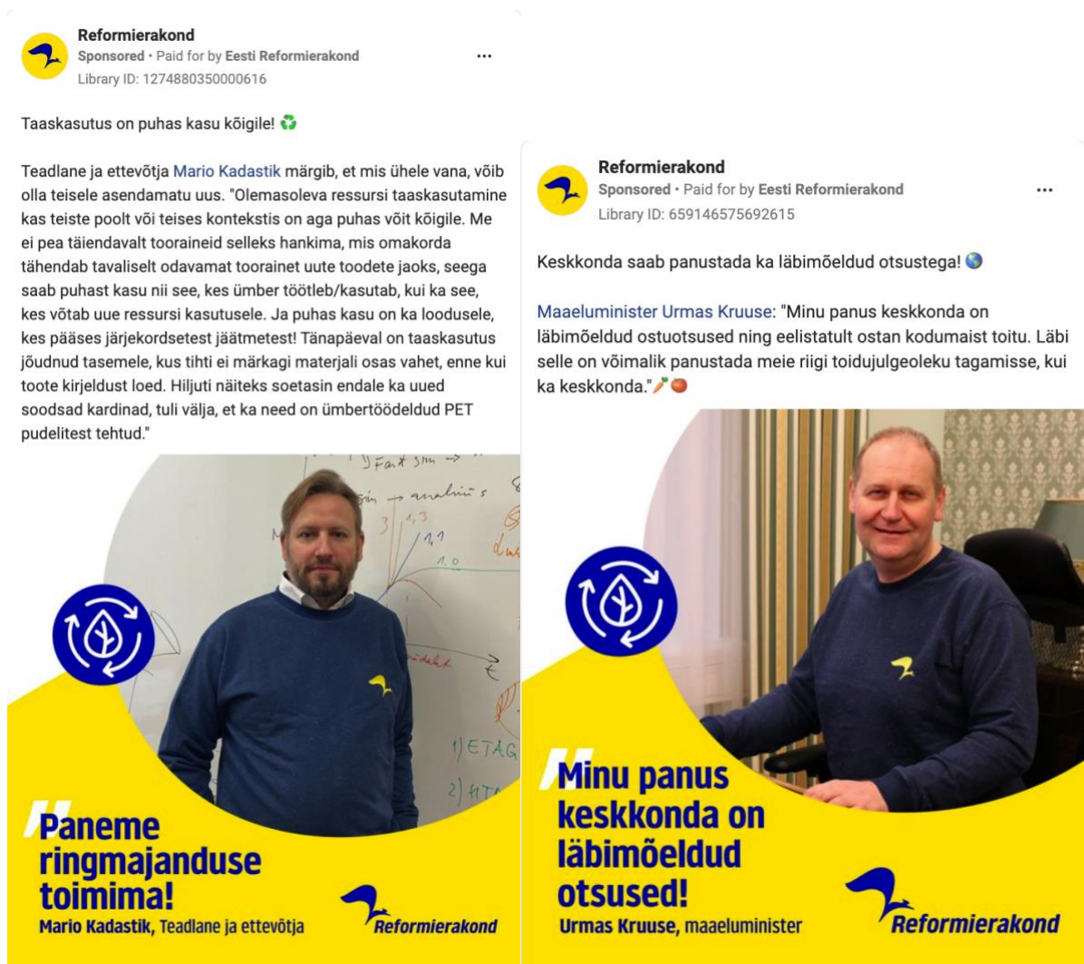
Joonis 8. Kuvatõmmised Eesti Reformierakonna malli A7 Facebooki valimisreklaamidest (reklaamid nr 70 ja 76, vt Lisa 1).

Reklaamidele on tsentraalselt jutumärkidesse kujundatud hüüdlause, mida on üheksat erinevat. Näiteks "Minu panus keskkonda on teadlikud valikud!" (reklaam nr 69), "Paneme ringmajanduse toimima!" (reklaamid nr 70 ja 73) ning "Rahvas ja riik peavad olema keskkonnateadlikud!" (reklaam nr 75). Lisaks on kahel reklaamil kasutatud ka Reformierakonnale omast sõnapaari "Keskond on kindlates kätes! " (nr 74 ja 78). Sarnaselt reklaamlausetele, kasutatakse ka A7 kaastekstides otsekõnet (kümnes reklaamis) või mina-vormi ilma jutumärkideta (ühes reklaamis). Kombinatsioon sellest ja keskmisest familiaarsemast fotost võib omada vaatajale sõbralikku tähendust ning tekitada optimistlikku tunnet.