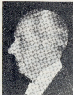
R. Martin du Gard.

Roger Martin du Gard, sünd. 1881. a., on tänapäeva silmapaistvamaid prantsuse kirjanikke. Nobeli auhind määrati talle 1937. a.