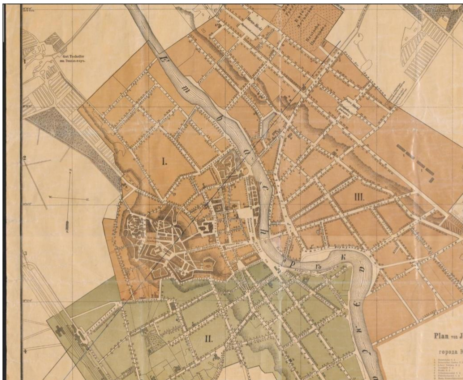
Tartu linna kaart aastast 1900.