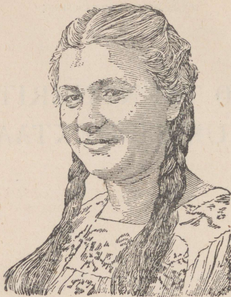
Sotsialistliku töö kangelane TAMAARA ŠURKO