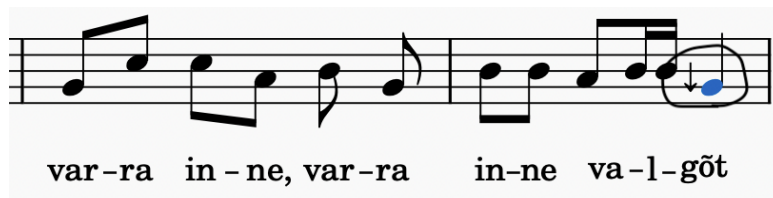
Joonis 5. Noodistus 2. värsi kordusest H. Villa esituses

R. A. tunnused 10: Võrdtempereeritud häälestus ja 8: Intonatsioonide hulga vaesumine: Villa esituses on mõned noodid meie mõistes “mustad”, ehk pisut madalamad kui võrdtempereeritud häälestuses. See on vanadele regilaulu esitustele omane nähtus. Siin üks näide mitmete samalaadsete hulgast: