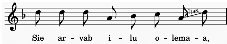
Joonis 4. Noodistus 2. värsist (ilma värsikorduseta) M. Nuudi esituses

Traditsiooniliselt kuulub igale noodile värsis üks silp. Vahepeal jagab Nuut neid silpe teisiti, näiteks teises värsis: