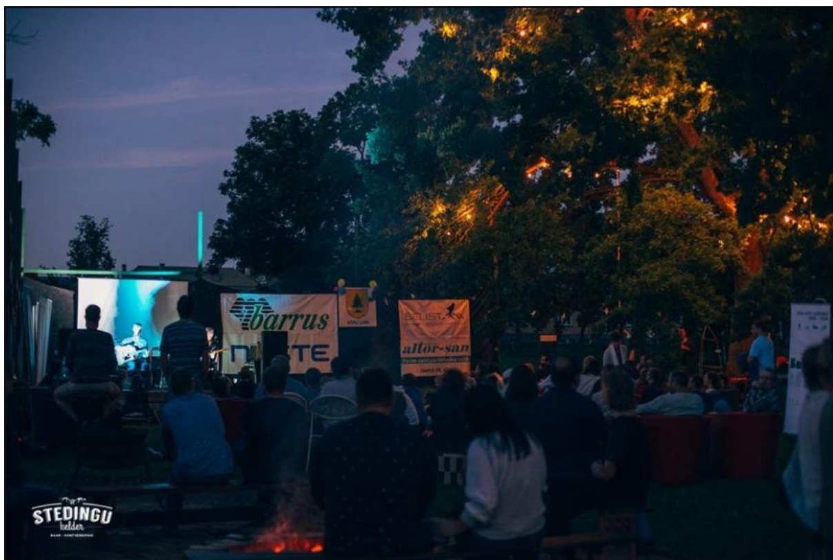
Lisa 7 - Foto sündmuse atmosfäärist.