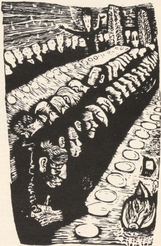
Illustration von P. Ulas zum Roman «Toomas Nipernaadi» von A. Gallit. Lithographie