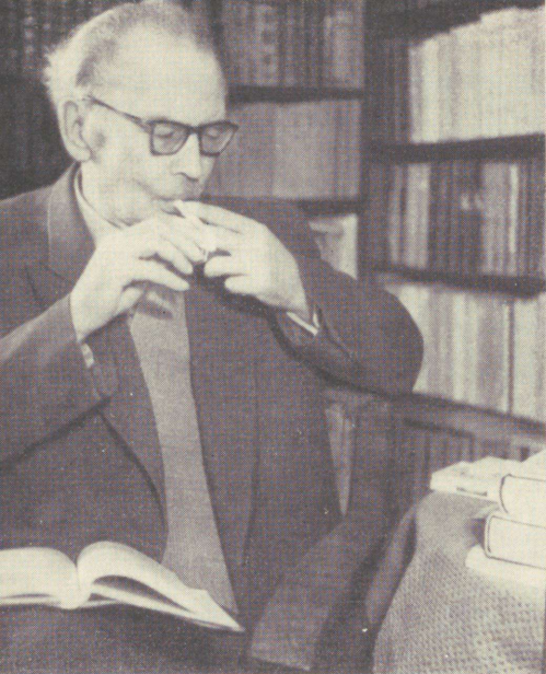
Friedebert Tuglas, Volksdichter der Estnischen SSR, korrespondierendes Mitglied der Akademie der Wissenschaften der Estnischen SSR

dankt ihre besten Leistungen der engen Verbundenheit unserer Dichter mit dem Volke und den demokratischen und humanistischen Traditionen, an denen unsere besten Dichter stets festgehalten haben. Was uns das literarische Erbe L. Koidulas, J. Liivs, E. Vildes, A. H. Tammsaares, J. Sütistes und vieler anderer immer wieder nahe bringt, ist der Umstand, daß ihre Kunst keine heimatlose Kunst für Auserwählte, kein «l'art pour l'art» Schaffen ist, sondern das Leben und Streben der Volksmassen künstlerisch widerspiegelt.