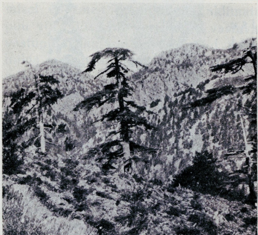
Pilt 79. Cedrus libani Cilitsia Tauruse mägedes Väike-Aasias. (Silva-Tarouca järgi.)

Okkad on 3—3½ sm. pikad, 30—40 tk. koos, värvilt tumerohelised. Käbi on 8—10 sm. pikk, 5—7 sm. läbimõõdus, pruun ja rohkesti vaiguga kaetud. Käbi on tipus vähe õõnes, soomus pehmete karvadega kaetud.