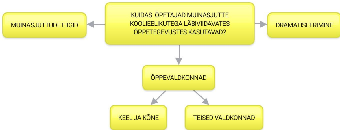
Joonis 2. Teise uurimisküsimuse teemade ja alateemade jaotus.

Õpetajate arvamused muinasjuttude kasutamise võimaluste kohta koolieelikutega läbiviidavates õppetegevustes jagunesid kolmeks peateemaks: „Muinasjuttude liigid”, „Õppevaldkonnad” (kaks alateemat) ja „Dramatiseerimine”. Teemad ja alateemad on näidatud joonisel 2.