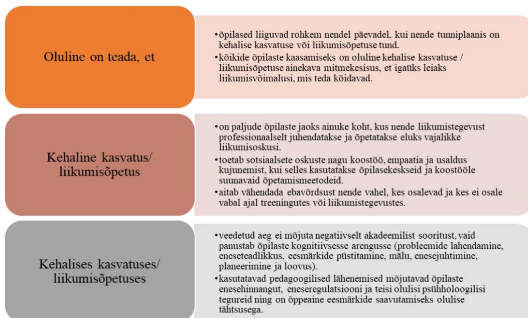
Joonis 1 Muutused kehalises kasvatuses

Inimese hea tervis ja liikumine on omavahel tihedalt seotud. Üldised hariduspoliitika eesmärgid nii Eestis kui mujal on seotud õpilaste vaimse ja füüsilise tervisega ning sellele on hakatud üha enam tähelepanu pöörama. Eesti põhikooli riikliku õppekava rahvusvahelises võrdluses on viidatud (Henno jt, 2021) OECD analüüsile “Making Physical Education Dynamic and Inclusive for 2030“, milles on välja toodud suunad hariduspoliitikaks, mille kaudu kujundada terveid ja liikuvaid inimesi. Viimastel aastatel tehtud uuringud, millele OECD analüüs tugines, kinnitavad joonisel 1 esitatud aspekte.