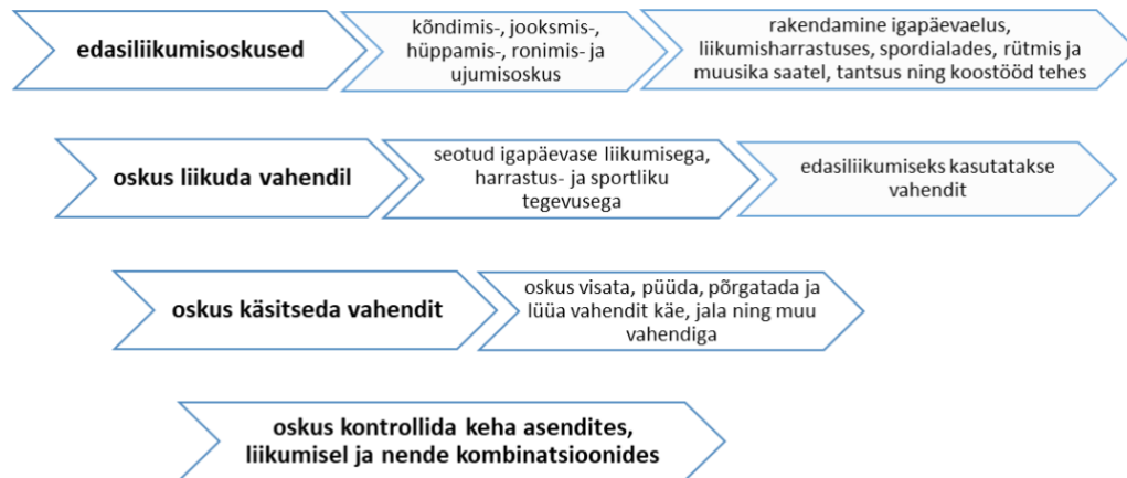
Joonis 2 Liikumisoskused kehalises kasvatuses

Õppekava järgi jagunevad liikumisoskused neljaks oskuste alarühmaks, mis kujunevad erinevate liikumisviiside rakendamise kaudu (vt joonis 2).