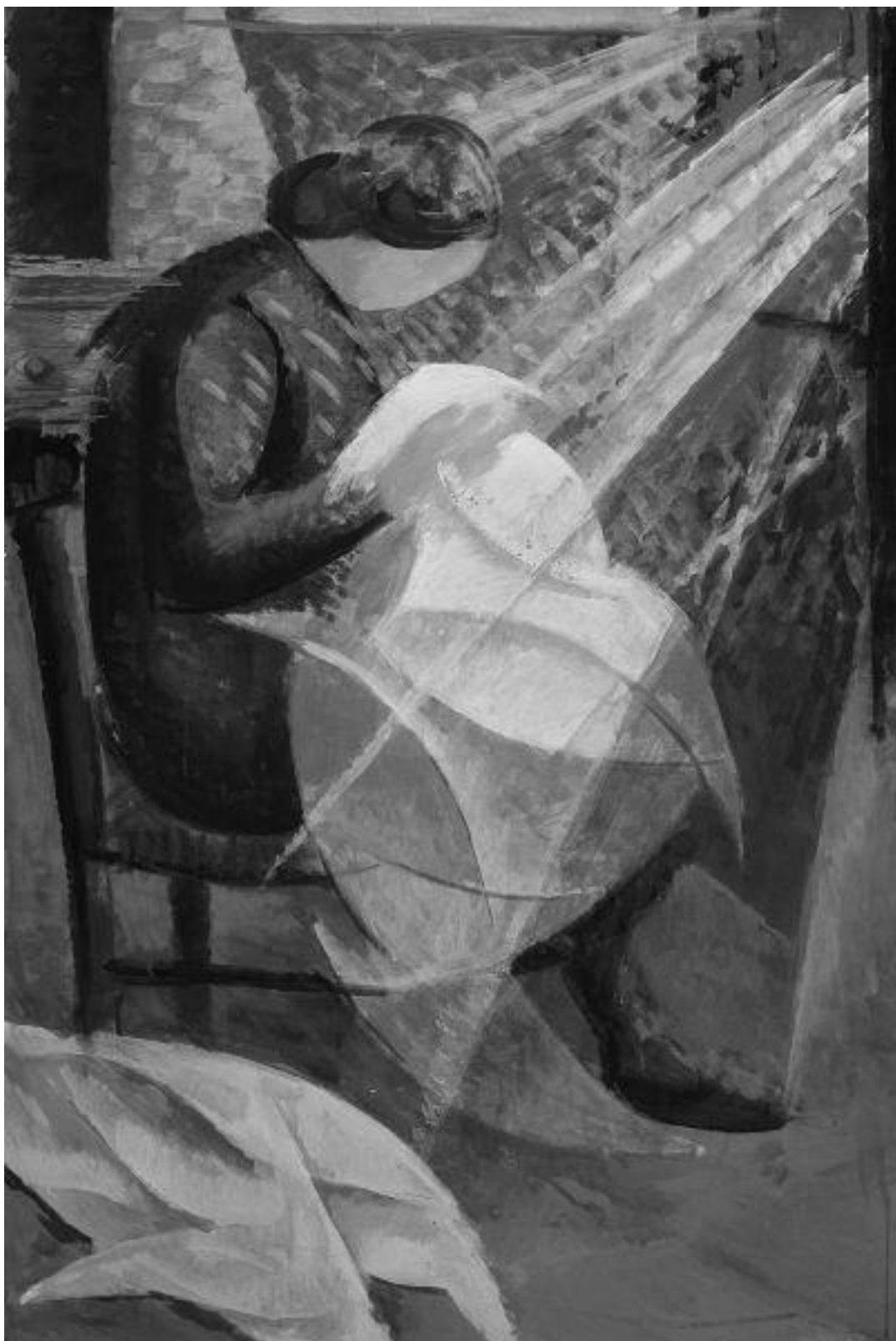
JOONIS 1.1. Quinto Martini (1908–90) sai inspiratsiooni kohalike inimeste igapäevaelust ja kujutas seda ka oma skulptuuridel ja maalidel, näiteks maalil „Naine õmblemas“ („Donna che cuce“).