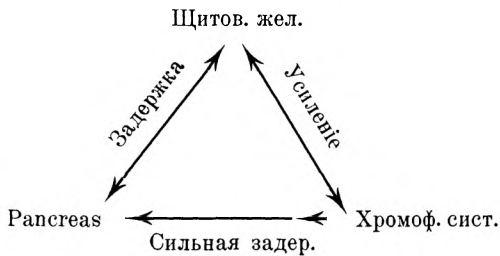
Схема это далеко не исчерпываетъ вопроса. Болѣе наглядно тотъ же вопросъ иллюстрируется слѣдующими данными: всѣ же-

Нѣкоторые авторы (Фальтъ, Эпшингеръ и др.) предлагаютъ такую схему для нагляднаго изображенія взаимоотношенія главныхъ железъ внутренней секреціи